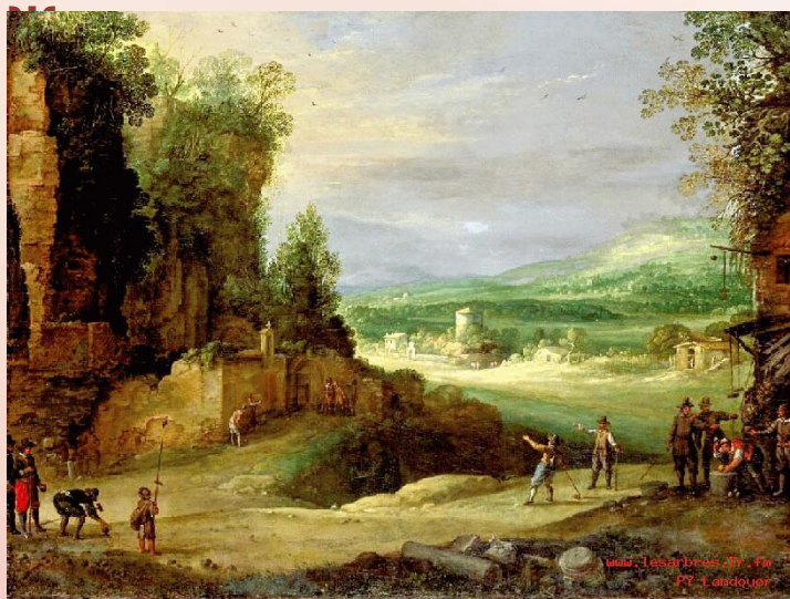
II веке в го испо

2. Концерт — циклическое произведение для какого-либо солирующего инструмента (фортепиано, скрипки и др.) и симфонического оркестра.