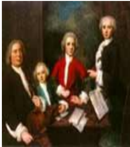
Бах и его сыновья