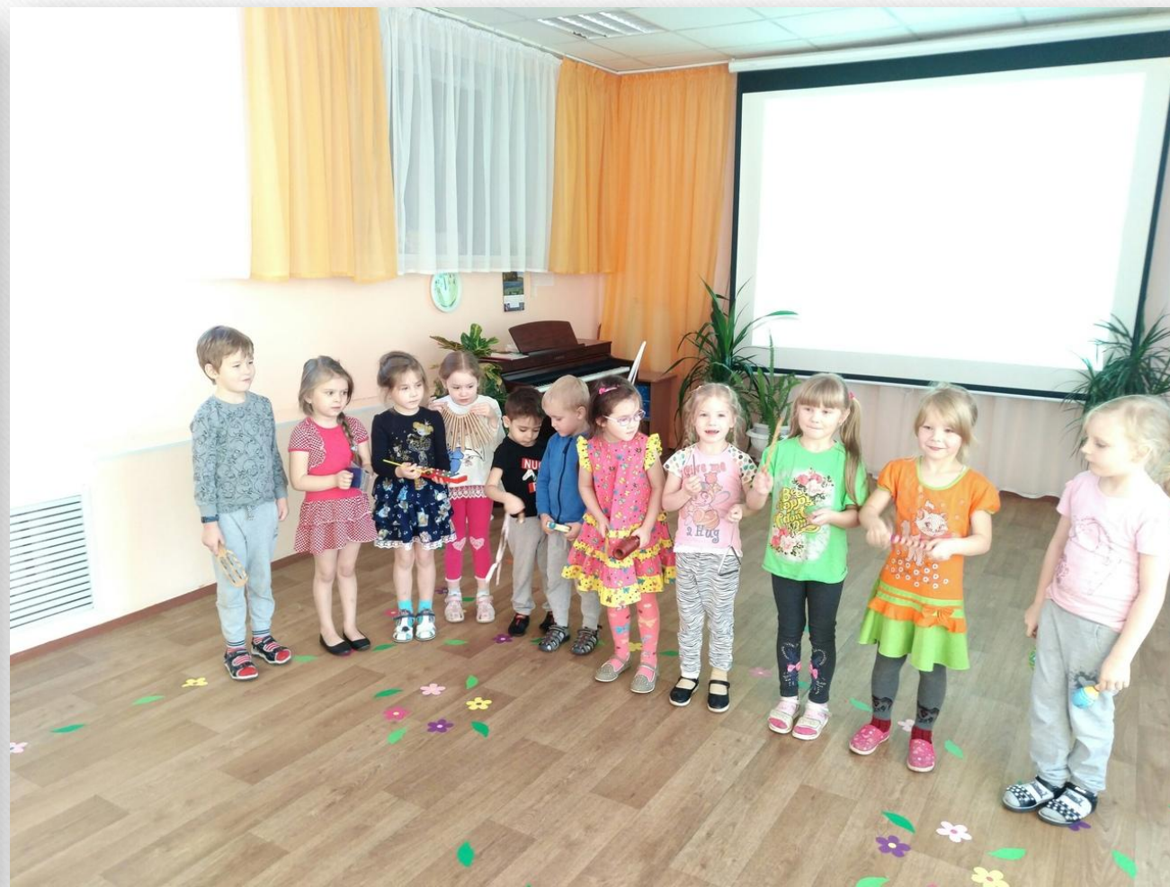
Показ презентации и игра в шумовом оркестре.