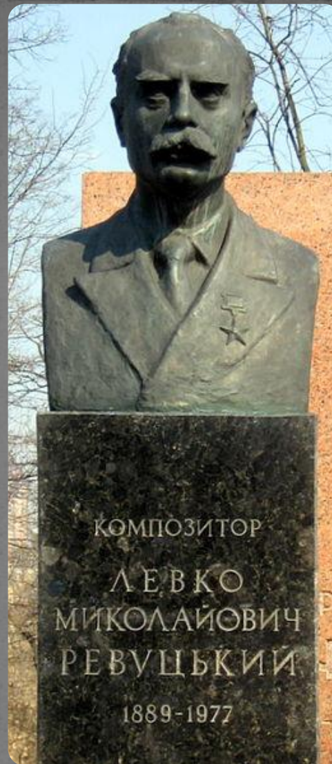
Надгробок Левка Ревуцького на Байковому цвинтарі в Києві