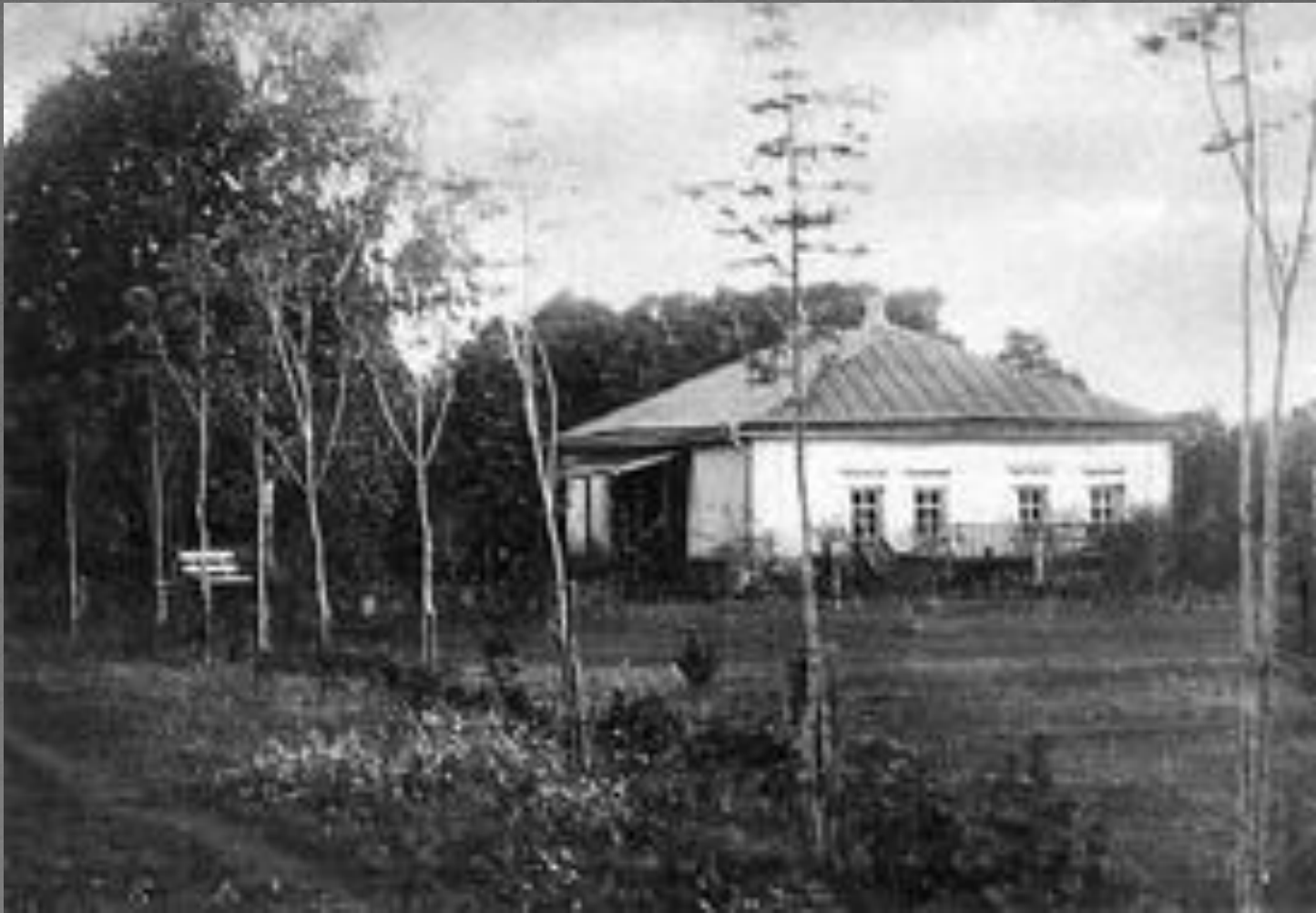
Будинок у якому виріс Лев Ревуцький