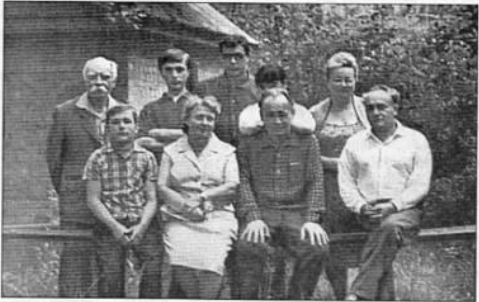
В колі рідних і знайомих, Бучанка. 1962 р.