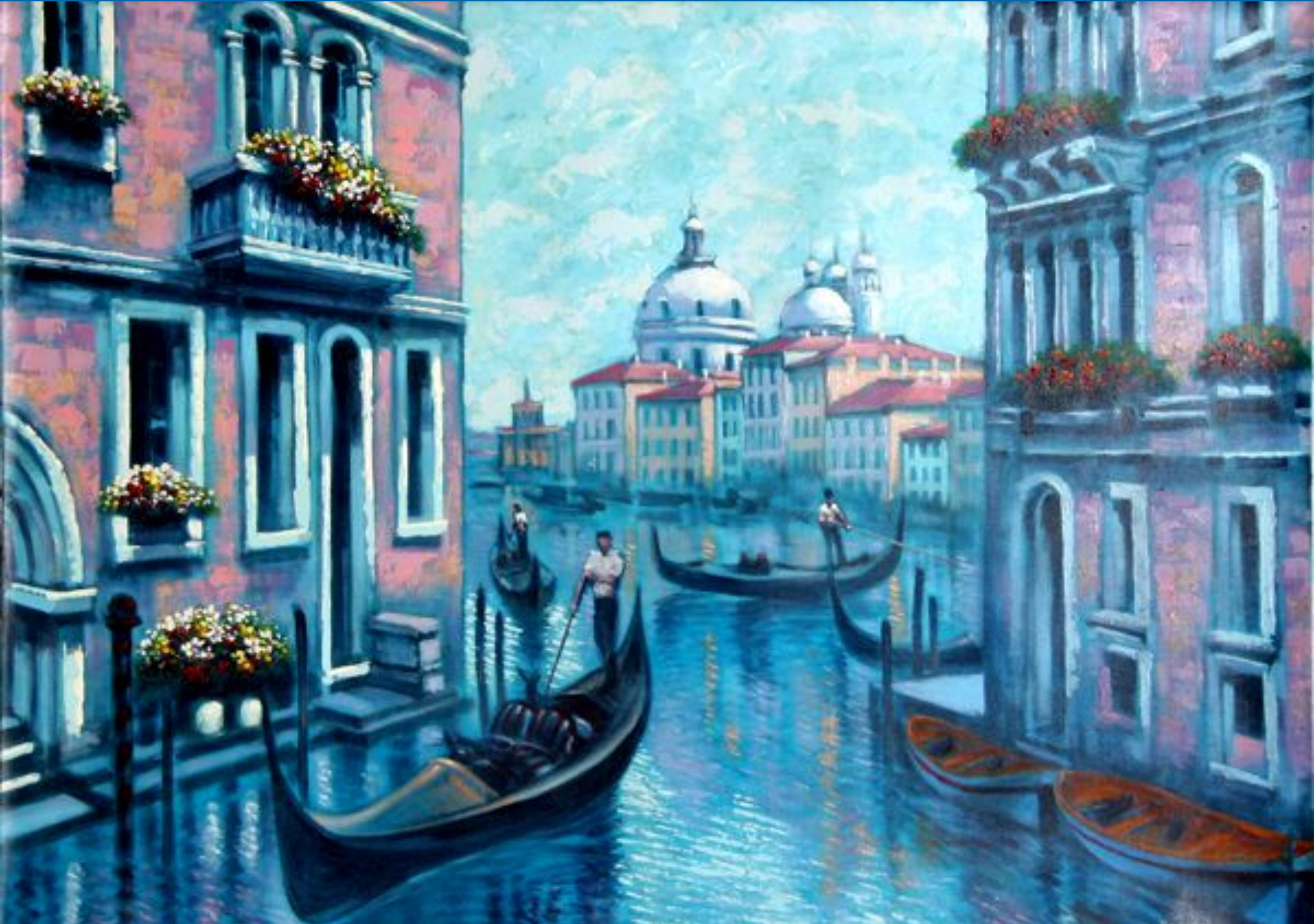
□ художник: Бассари ( Италия )