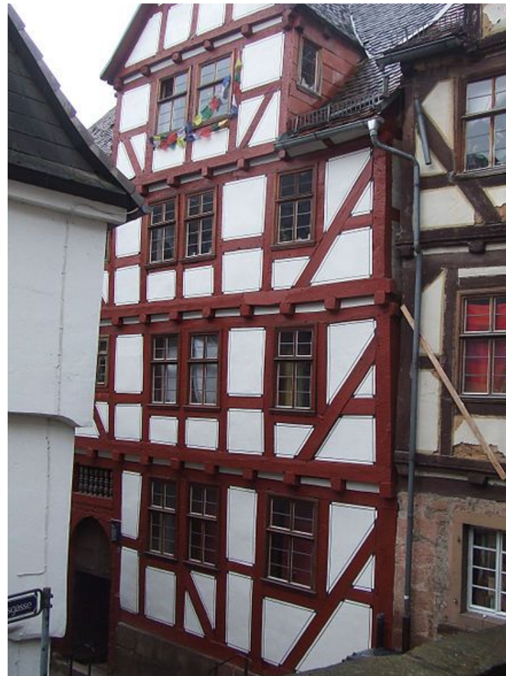
Дом, в котором Ломоносов жил в Марбурге за границей