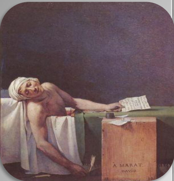
Давид «Смерть Марата»