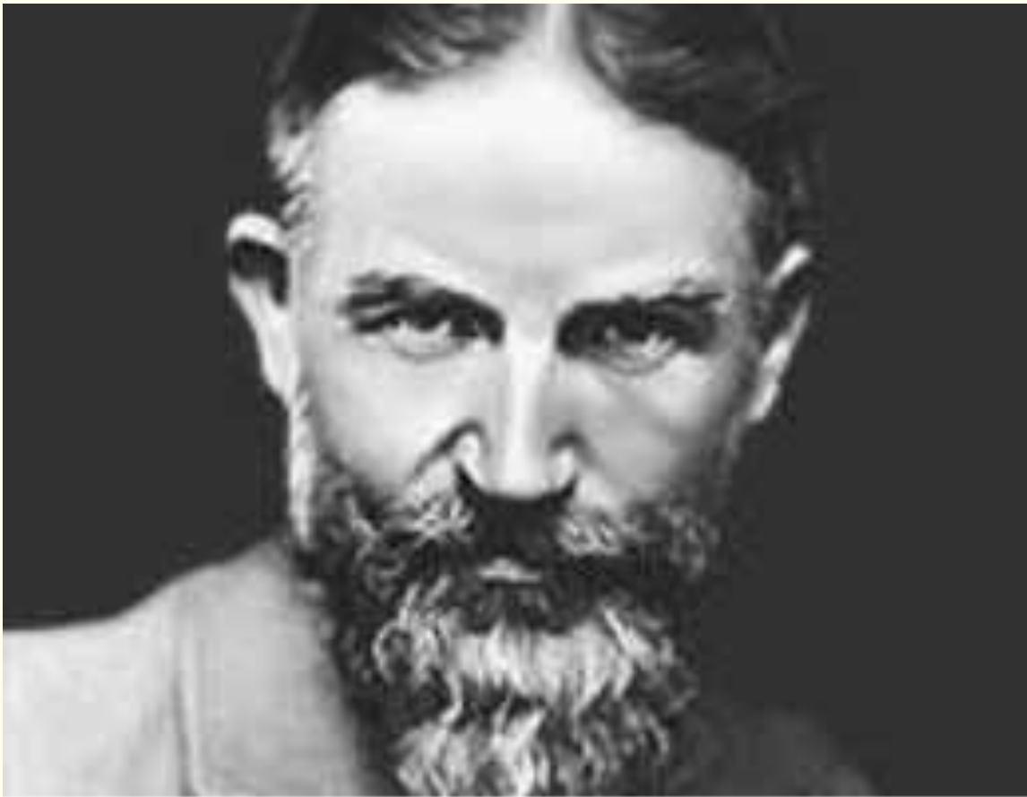
Джордж Бернард Шоу