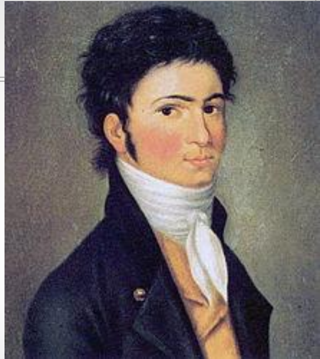
Бетховен в 30 лет.

«Ваши вещи прекрасные, это даже чудесные вещи, но то тут, то там в них встречается нечто странное, мрачное, так как Вы сами немного угрюмы и странны; а стиль музыканта — это всегда он сам.»