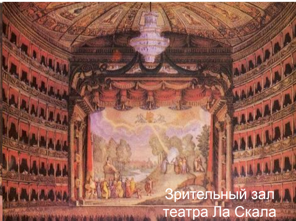
Зрительный зал театра Ла Скала