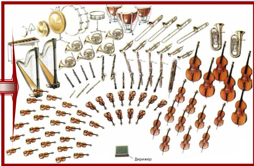
Схема симфонического оркестра