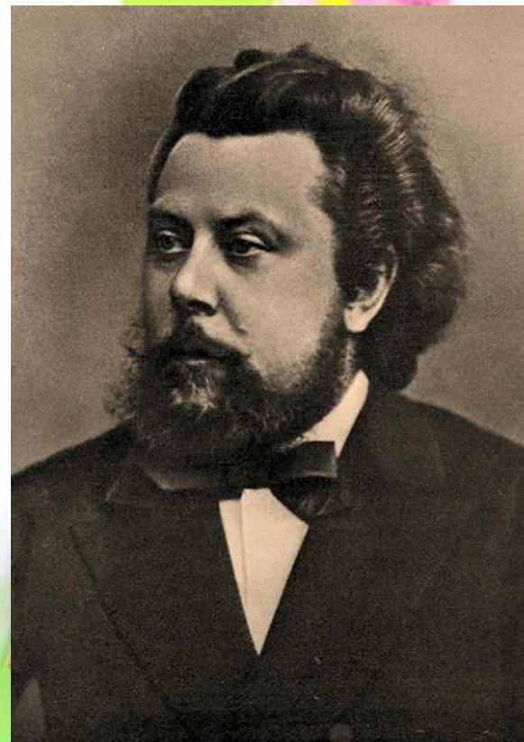
Модест Петрович Мусоргский