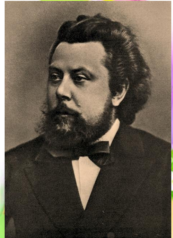
Модест Петрович Мусоргский