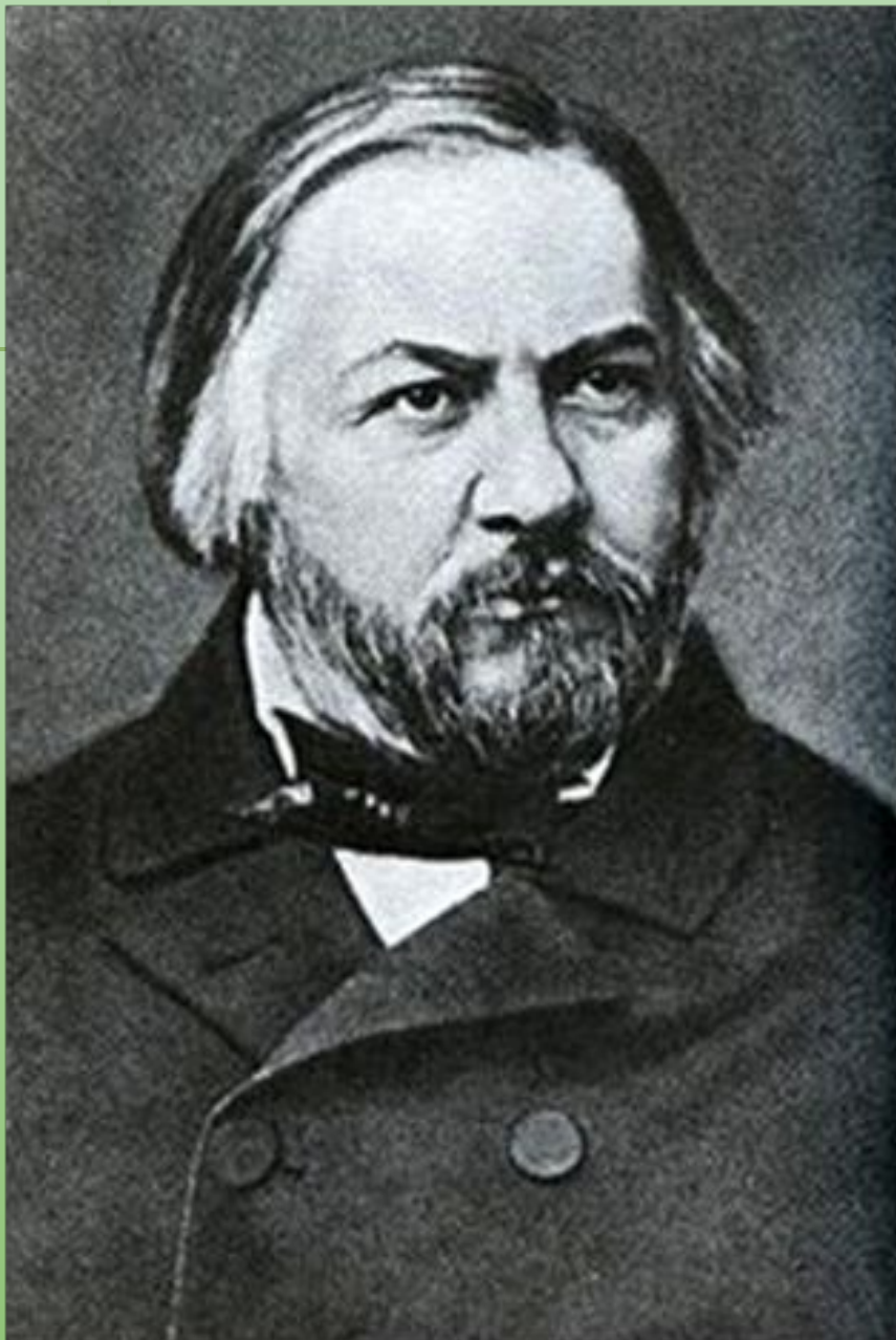
фото Сергея Левицкого фото

Дата рождения 20 мая ( 1 июня ) Дата рожде ния 20 мая (1 июня) 1804