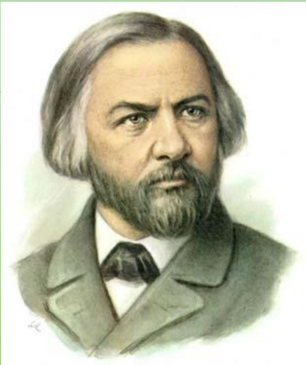
Портрет М. И. Глинки 1856 год