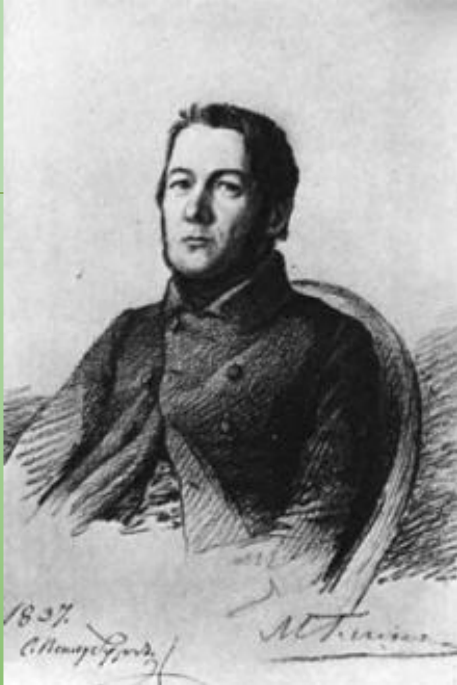
Портрет М.И. Глинки 1837 год