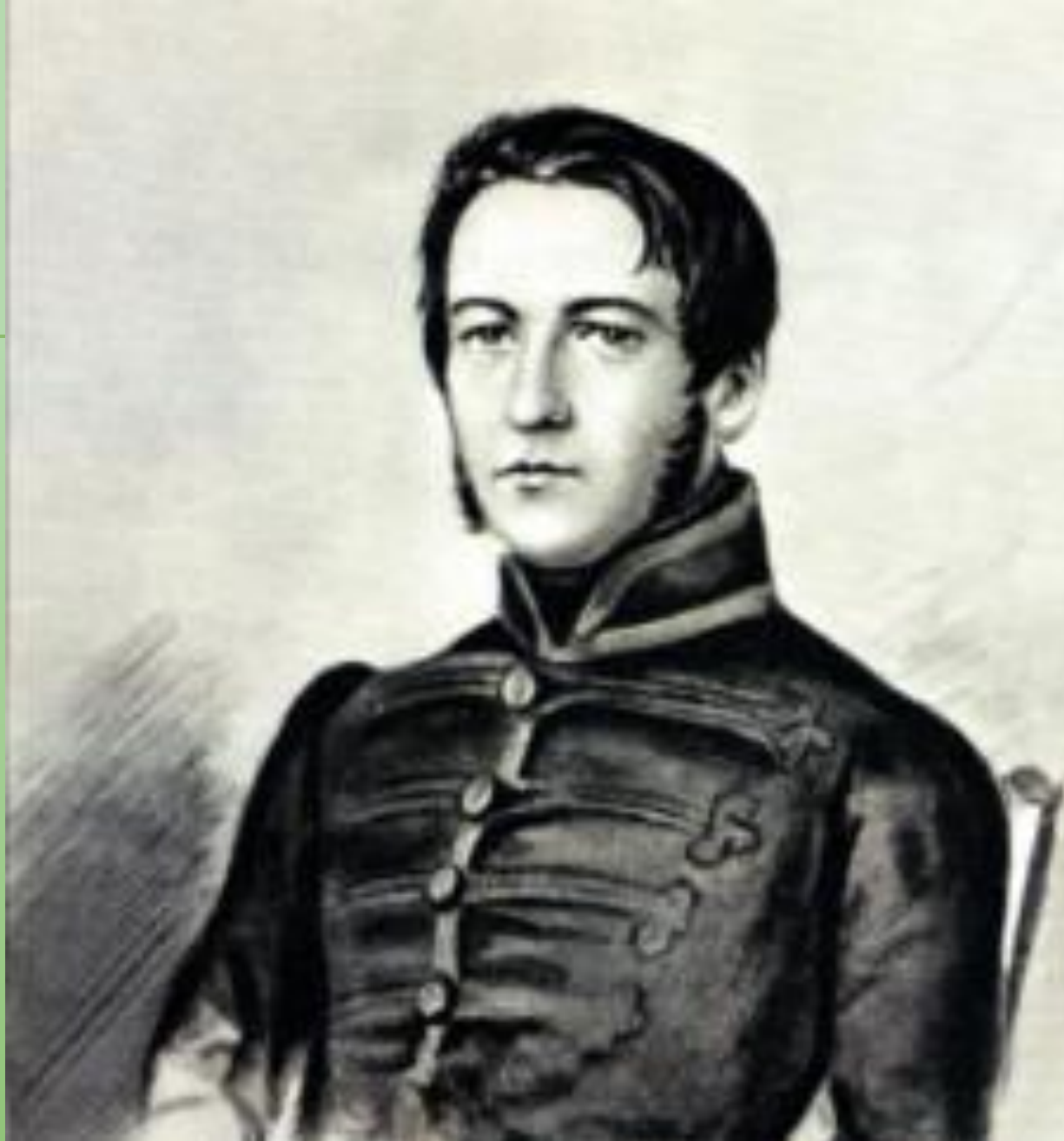
Портрет М. И. Глинки 1823 год