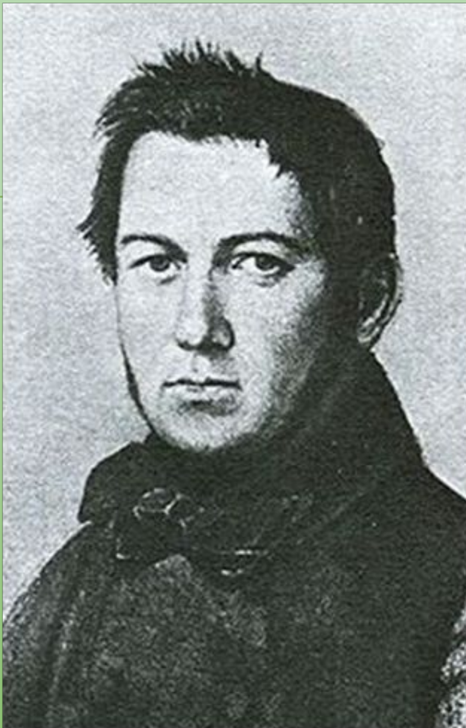
Портрет М. Глинки кисти художника Я. Ф. Яненко, 1840-е годы