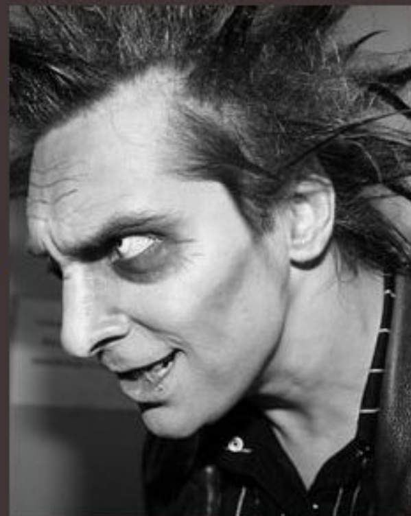
Михаил Горшенев (Король и Шут)

"Я уйду в тот момент, когда не успею Вам надоест. А Вы будете помнить меня добрым словом, за то, что я не надоел и не стал дураком, зарабатывающим на Вас деньги..."