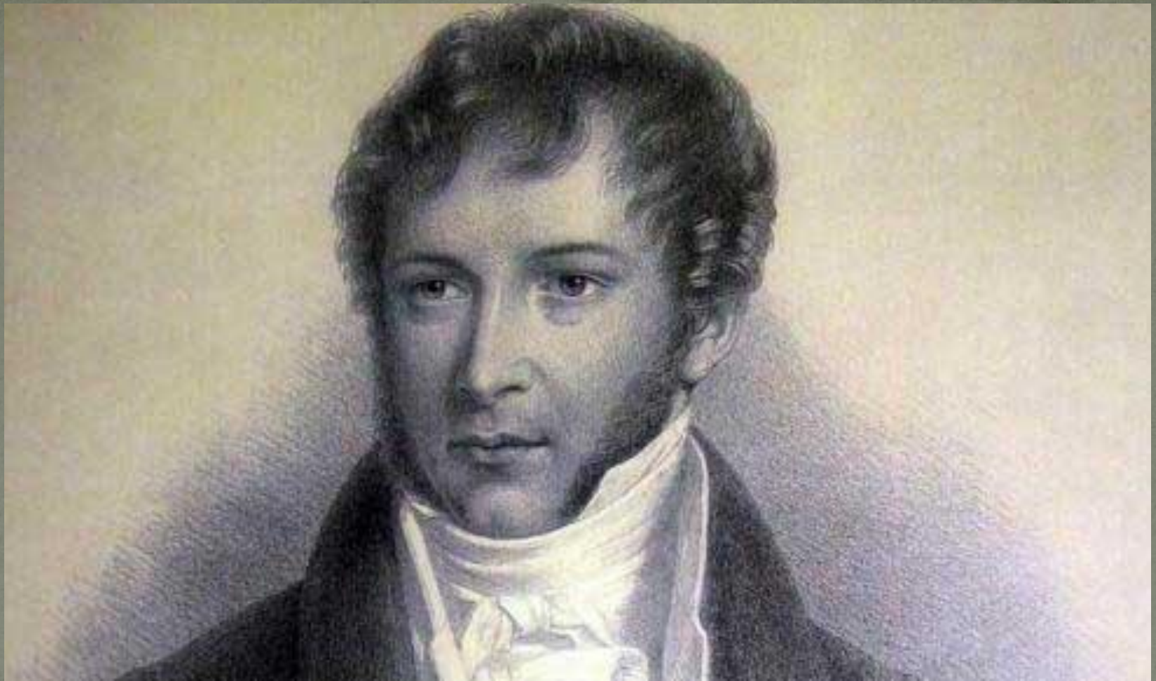
МИХАИЛ КЛЕОФАС ОГИНСКИЙ (1765 – 1833)