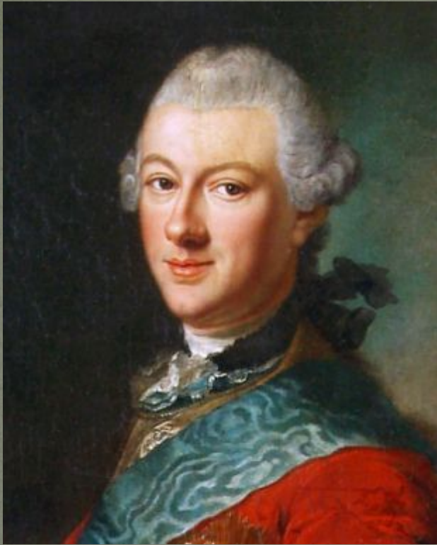
Князь Михаил Казимир Огинский (1729-1800) (троюродный дядя)