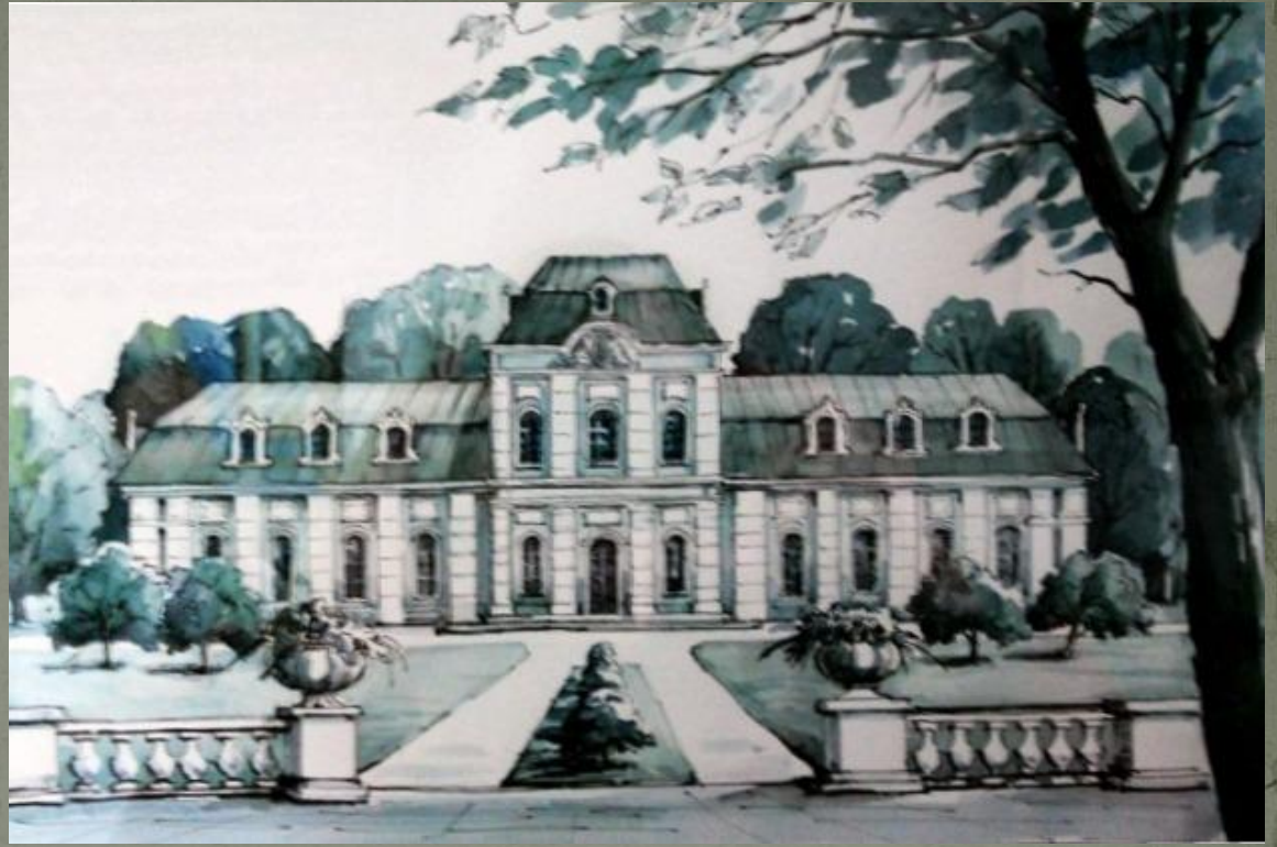
Театр князя Михаила Казимира Огинского в Слониме (не сохранился). Рисунок из фондов Слонимского историко-краеведческого музея.