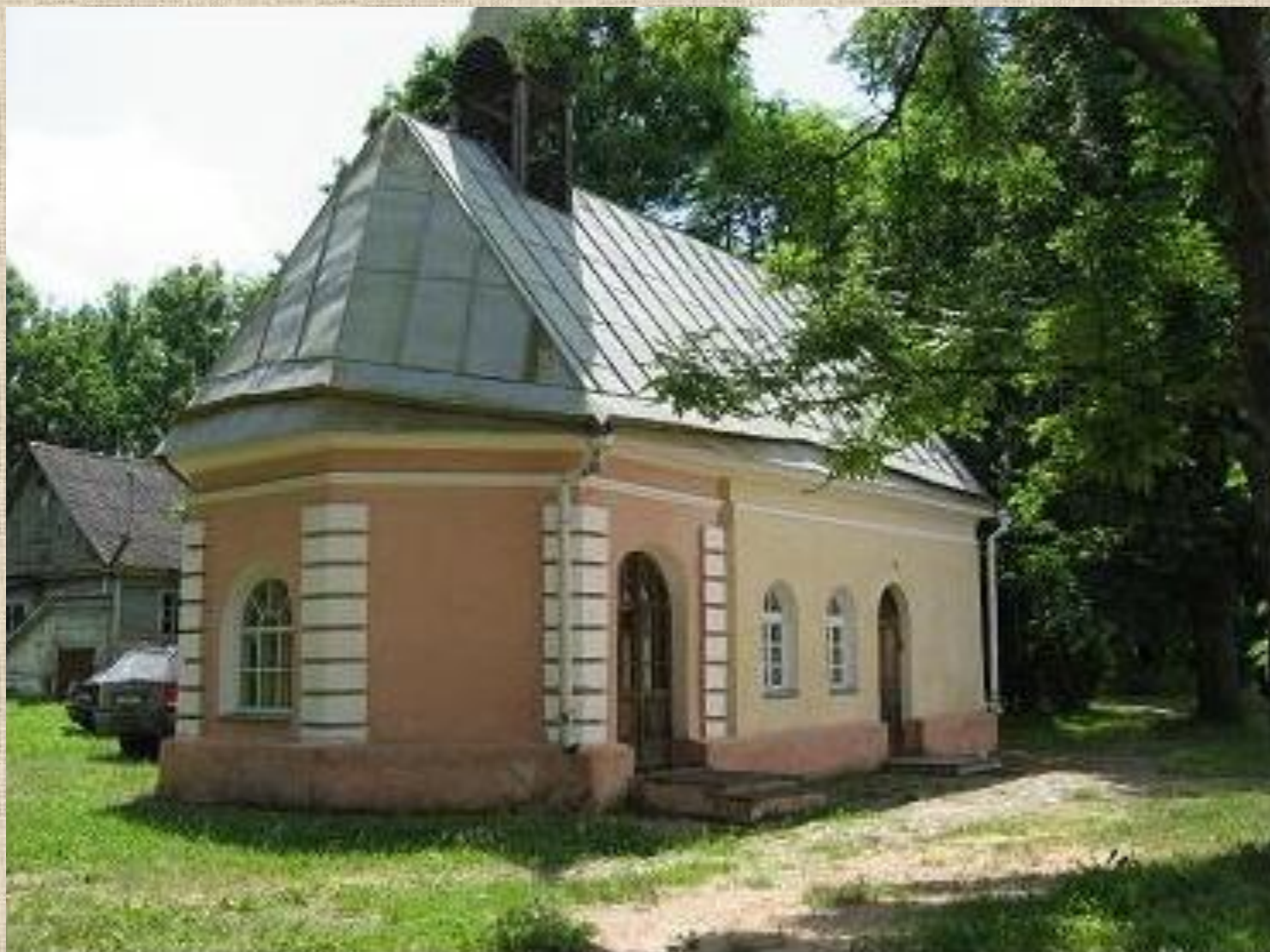
Усадебная часовня 19 века