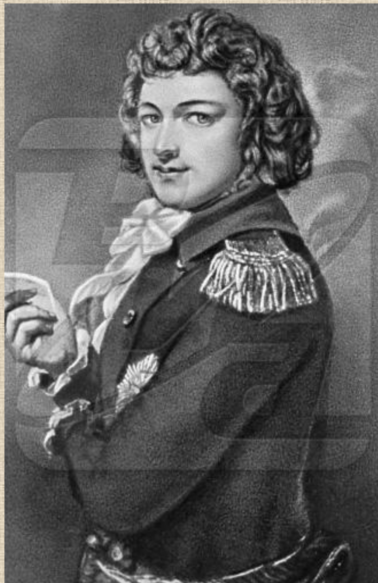
Михаил Клеофас Огинский