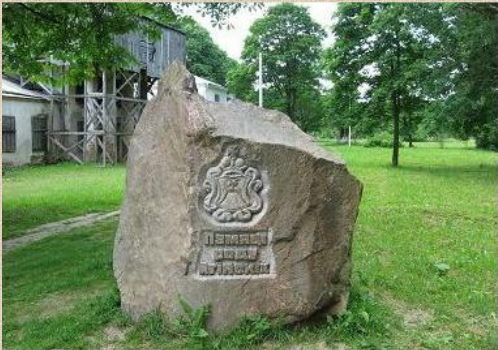
Камень памяти композитора в усадьбе