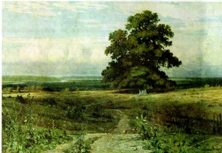
И. Шишкин. Среди долины ровныя

Шишкин знал природу «учёным образом». Из этого знания и любви к ней родились образы, которые стали своеобразными символами России.