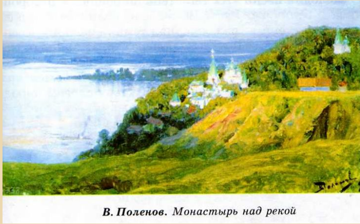
В. Поленов. Монастырь над рекой