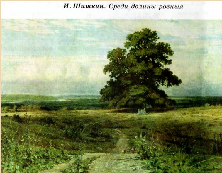
И. Шишкин. Среди долины ровныя

Шишкин знал природу «учёным образом». Из этого знания и любви к ней родились образы, которые стали своеобразными символами России.