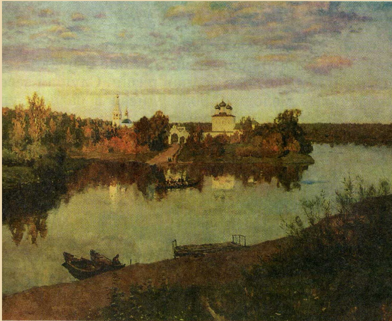
И. Левитан. Вечерний звон

Левитан Иссак Ильич (1860 -1900) – русский живописец. Передвижник.