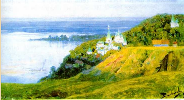
В. Поленов. Монастырь над рекой