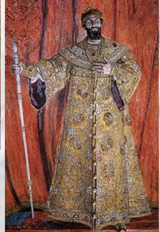
Ф. Шаляпин в роли Бориса Годунова

Известность М. принесла опера «Борис Годунов», поставленная на сцене Мариинского театра в СПб. в 1874 г. и сразу же признанная выдающимся произведением.