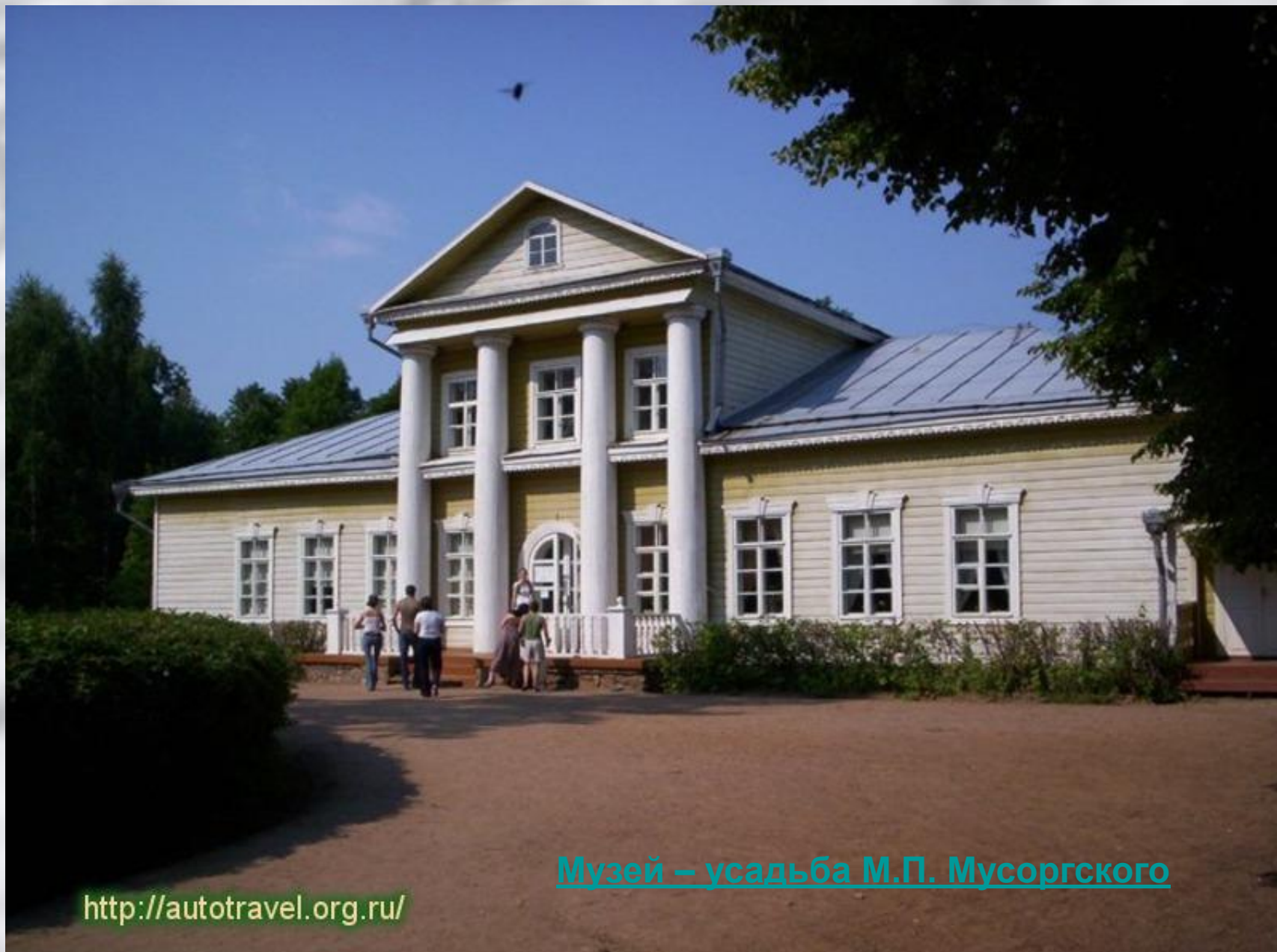
Музей – усадьба М.П. Мусоргского