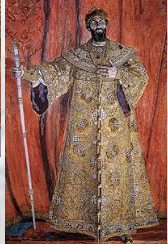
Ф. Шаляпин в роли Бориса Годунова

Известность М. принесла опера «Борис Годунов», поставленная на сцене Мариинского театра в СПб. в 1874 г. и сразу же признанная выдающимся произведением.