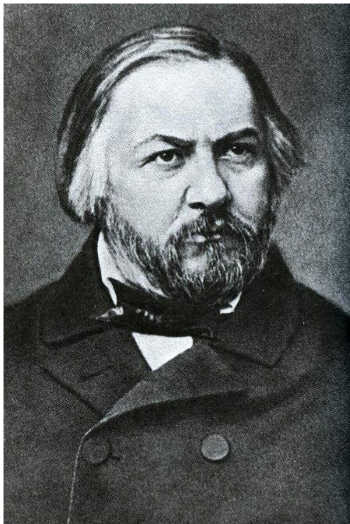
Михаил Иванович Глинка (1804-1857)

Композиторы «Могучей кучки» по праву считали себя наследниками М.И.Глинки и свою цель видели в развитии русской национальной музыки.