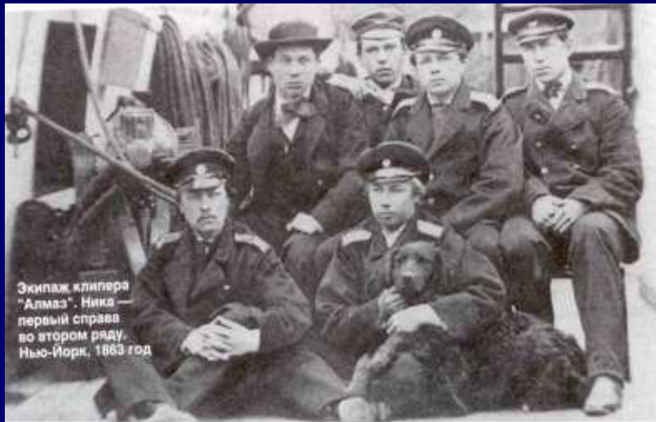
Экипаж клипера "Алмаз". Нико первый справа во втором ряду. Нью-Йорк, 1863 год

Римский-Корсаков происходил из древнего дворянского рода. Родился в старинном городке Тихвин Новгородской губернии. Здесь любили праздники, свято соблюдали обычаи – зиму провозжали песнями и плясками, сжигали чучело Масленицы, весну встречали венками и хороводами, в ночь на Ивана Купалы жгли костры, а свадьбы справляли после уборки хлебов. Все это не раз наблюдал маленький Ника, прогуливаясь с матерью или дядюшкой в окрестностях города. Возвращаясь вечером, садились пить чай с вареньем.