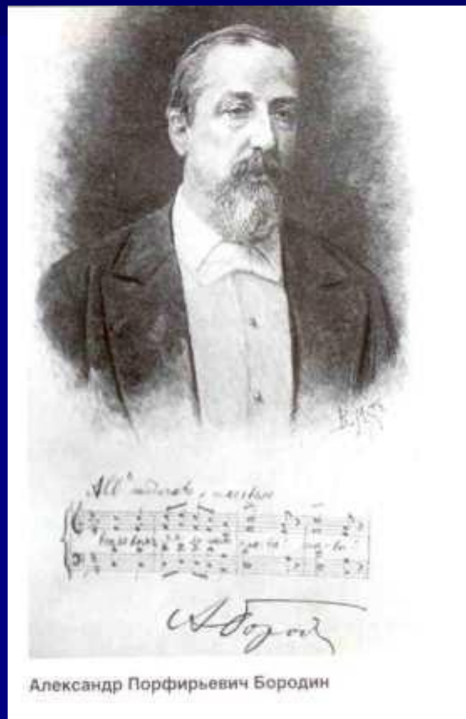
Александр Порфирьевич Бородин