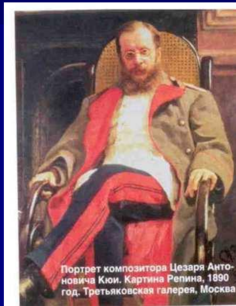
Портрет композитора Цезаря Антоновича Кюи. Картина Репина, 1890 год. Третьяковская галерея, Москва

Вообще-то Цезарь Антонович Кюи был на два года старше Балакирева. И к 1856г., когда юный музыкант только завоевывал столицу, он уже окончил солидную Инженерную академию. Кюи хорошо разбирался в музыке, играл на скрипке и фортепиано и даже пробовал сам писать. В его родном городе Вильно гармонией с ним занимался знаменитый польский композитор Станислав Монюшко.