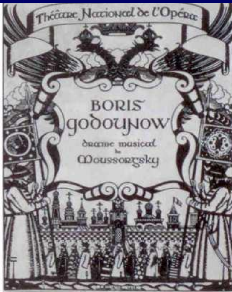
Обложка программы спектакля "Борис Годунов" для дягилевского "Русского сезона" 1908 года. Рисунок Ивана Билибина