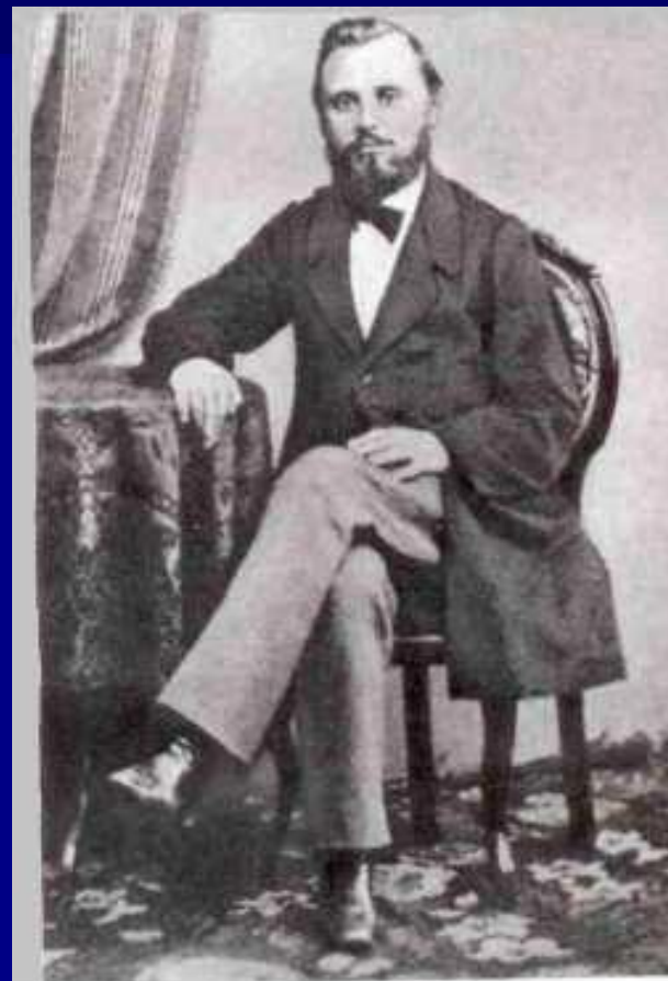
Милий Балакирев. Таким он был, когда создавался Балакиревский кружок. 1860-е годы