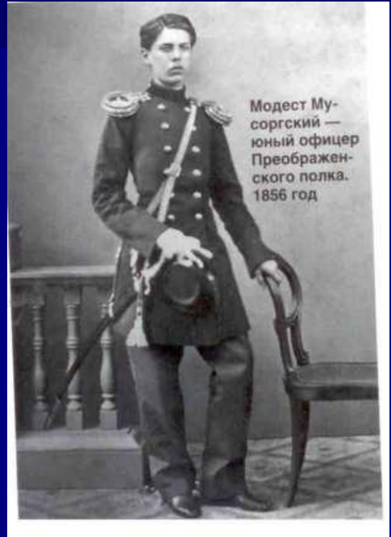
Модест Мусоргский — юный офицер Преображенского полка. 1856 год

А начиналось все идиллически – Мусоргский стал третьим постоянным участником балакиревских музыкальных вечеров. Случилось это в 1857г., когда будущему гениальному композитору было все лишь 17 лет. Родина его – село Карево на Псковщине. Русская глушь, где сам «дух народной жизни», как говорил Модест Петрович, сохранился в неприкосновенности. Первые музыкальные опыты Мусоргского проходили дома под руководством матери. Десяти лет от роду потомка старинного дворянского рода отвезли в Петербург, в Школу гвардейских подпрапорщиков.