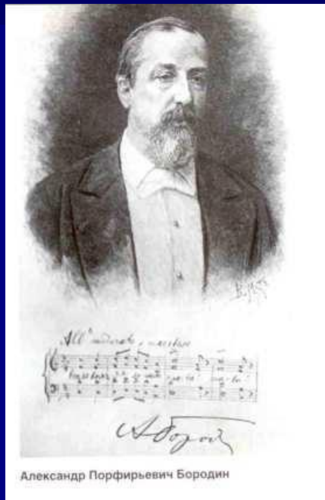
Александр Порфирьевич Бородин