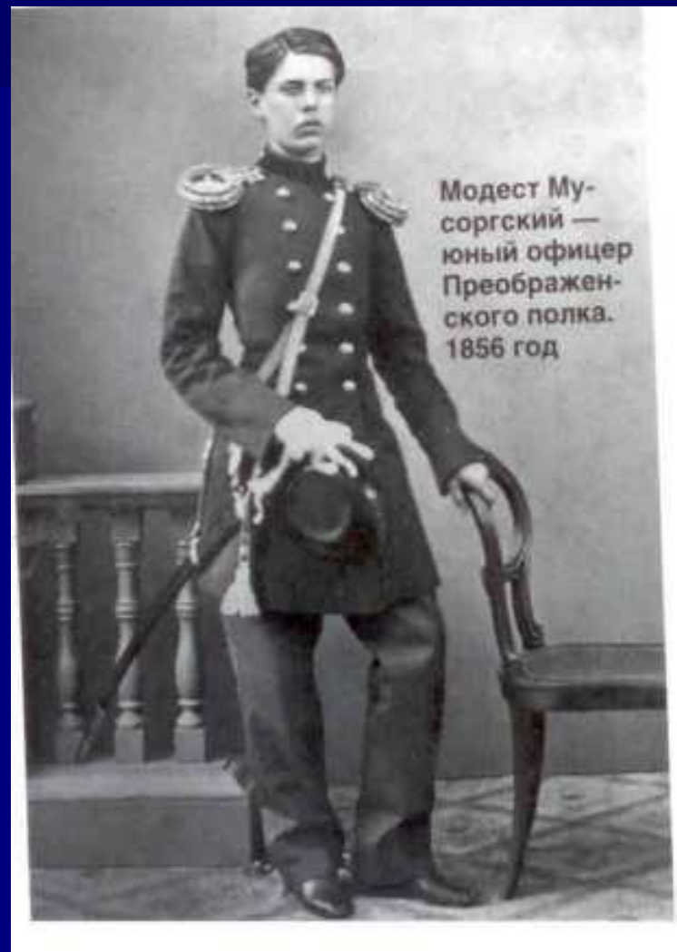
Модест Мусоргский — юный офицер Преображенского полка. 1856 год

А начиналось все идиллически – Мусоргский стал третьим постоянным участником балакиревских музыкальных вечеров. Случилось это в 1857г., когда будущему гениальному композитору было все лишь 17 лет. Родина его – село Карево на Псковщине. Русская глушь, где сам «дух народной жизни», как говорил Модест Петрович, сохранился в неприкосновенности. Первые музыкальные опыты Мусоргского проходили дома под руководством матери. Десяти лет от роду потомка старинного дворянского рода отвезли в Петербург, в Школу гвардейских подпрапорщиков.