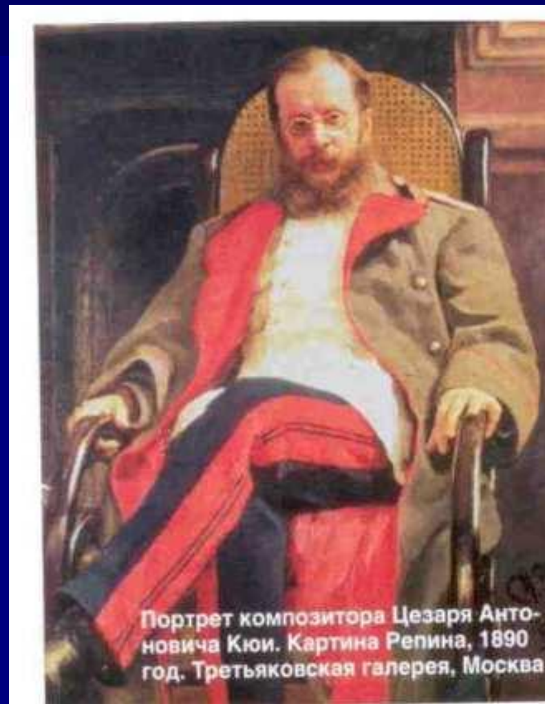
Портрет композитора Цезаря Антоновича Кюи. Картина Репина, 1890 год. Третьяковская галерея, Москва

Вообще-то Цезарь Антонович Кюи был на два года старше Балакирева. И к 1856г., когда юный музыкант только завоевывал столицу, он уже окончил солидную Инженерную академию. Кюи хорошо разбирался в музыке, играл на скрипке и фортепиано и даже пробовал сам писать. В его родном городе Вильно гармонией с ним занимался знаменитый польский композитор Станислав Монюшко.