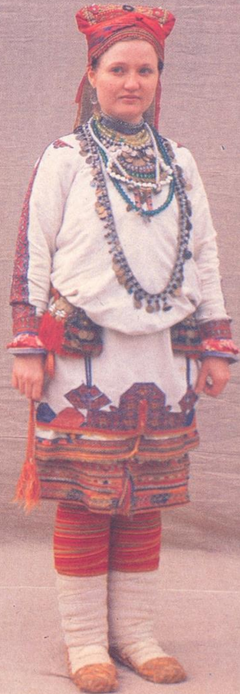
121, 122. Костюм невесты-мокшанки. Конец XIX — начало XX вв. Тамбовская губерния, Темниковский уезд.