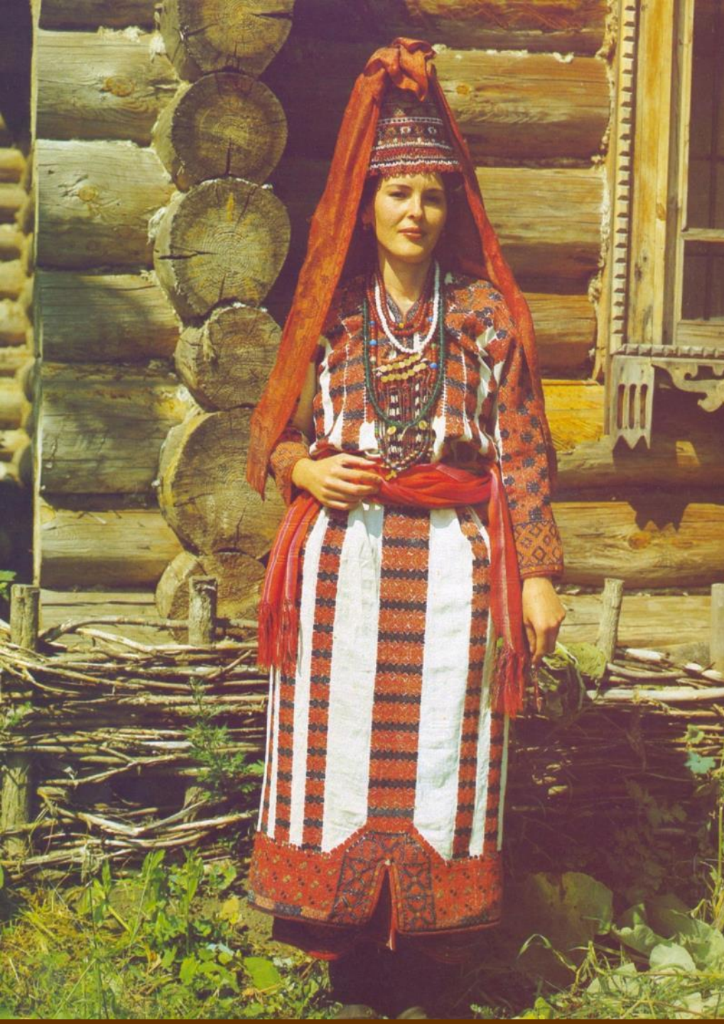
Костюм невесты. Мордва-эрзя. XIX век