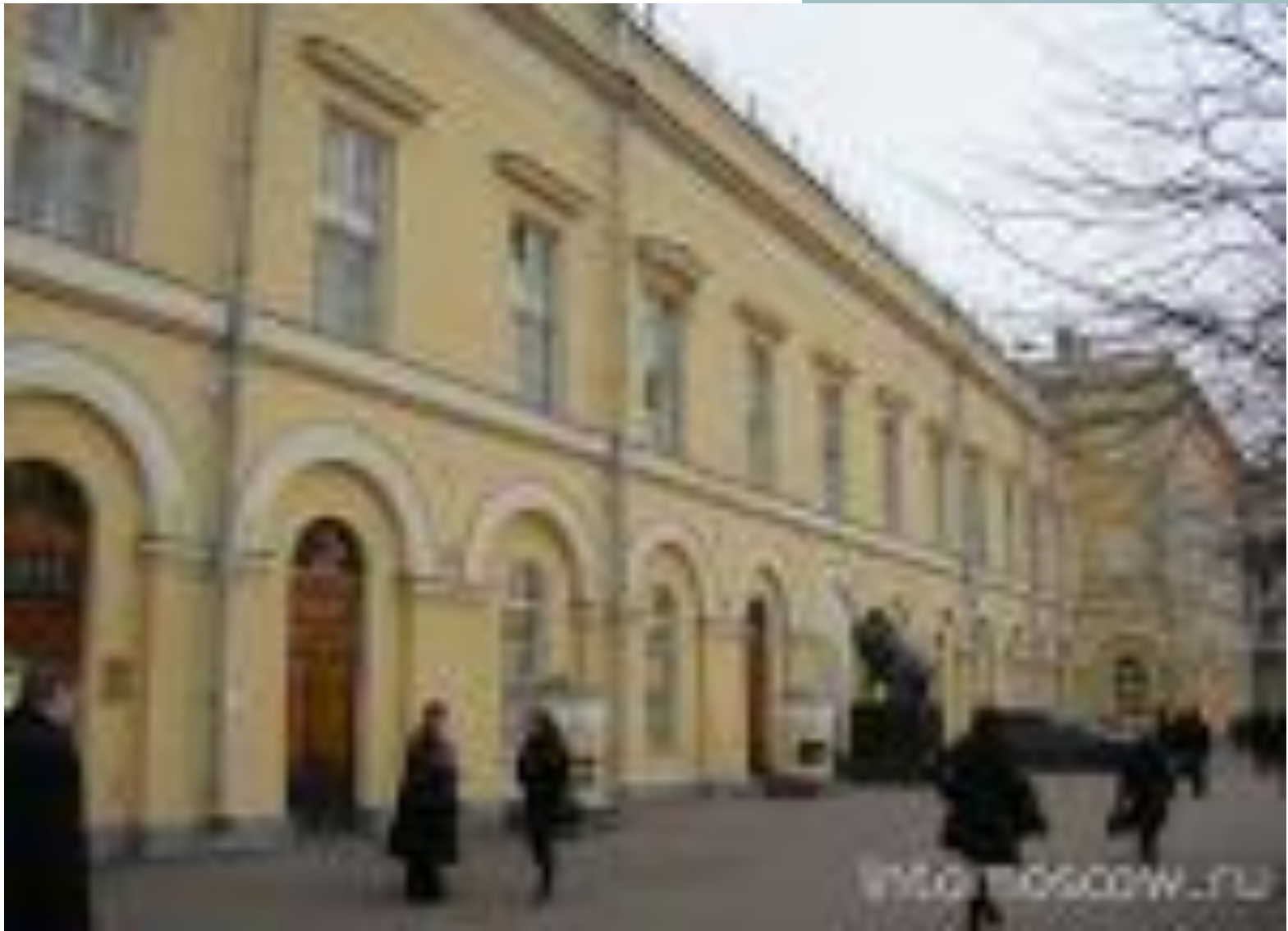
Московский Малый театр