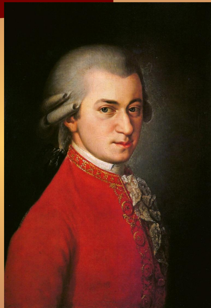
Вольфганг Амадей Моцарт

Известный композитор, который обладал просто отменным музыкальным вкусом - Вольфганг Амадей Моцарт. Этот австрийский композитор относится к одним из самых известных и значимых представителей Венской классической школы. Моцарт стоит на одном уровне с Бетховеном и Гайдном.