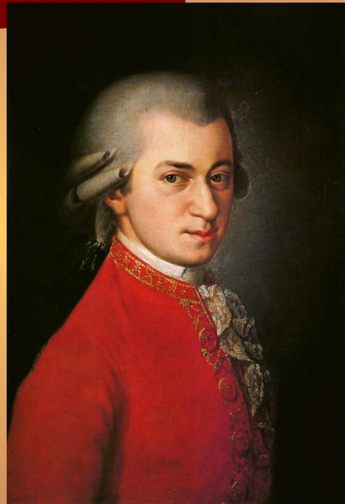
Вольфганг Амадей Моцарт

Известный композитор, который обладал просто отменным музыкальным вкусом - Вольфганг Амадей Моцарт. Этот австрийский композитор относится к одним из самых известных и значимых представителей Венской классической школы. Моцарт стоит на одном уровне с Бетховеном и Гайдном.