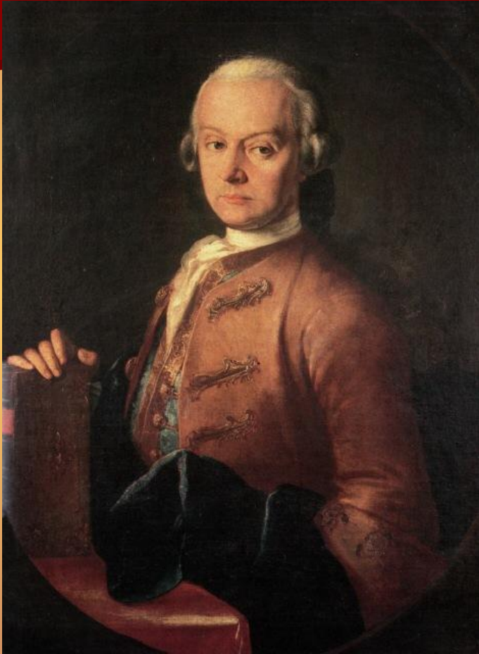
Леопольд Моцарт (отец)

Моцарт родился в небольшом австрийском городе Зальцбурге. При крещении на второй день от роду ему было присвоено длинное имя. Однако в народе его именуют сокращенно - Вольфганг Амадей Моцарт. Его отец являлся известным музыкантом. Именно он обучил маленького композитора игре на пианино, органе и скрипке.