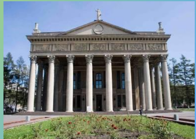
Новокузнецкий драматический театр