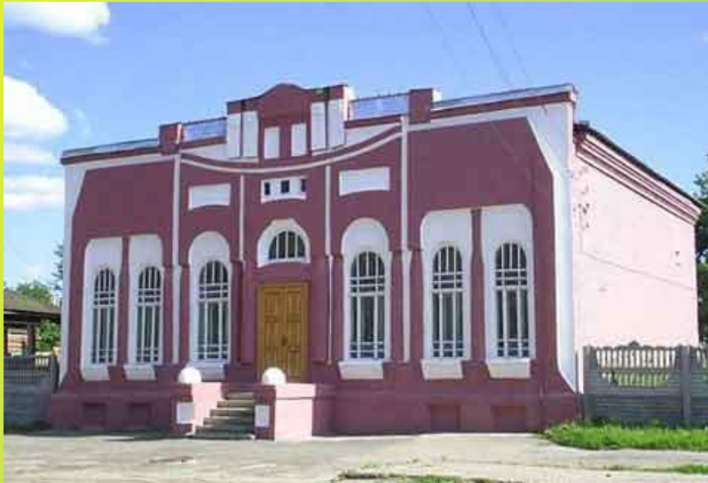
Новокузнецкий краеведческий музей — самый первый музей Кузбасса