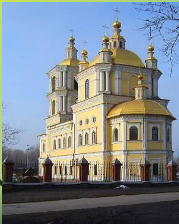
Первый храм Новокузнецка Спасо-Преображенский