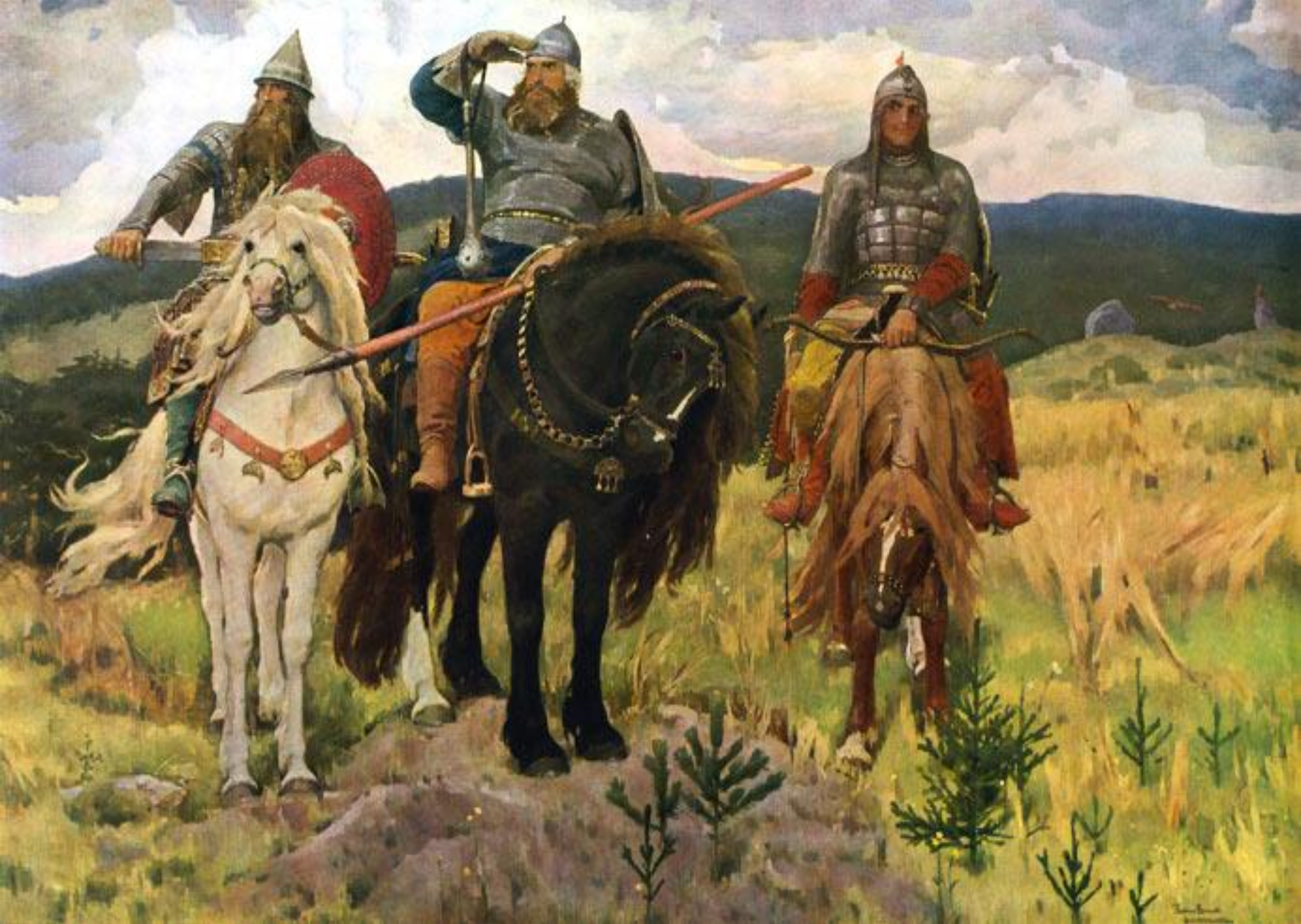
В.М. Васнецов «Три богатыря».