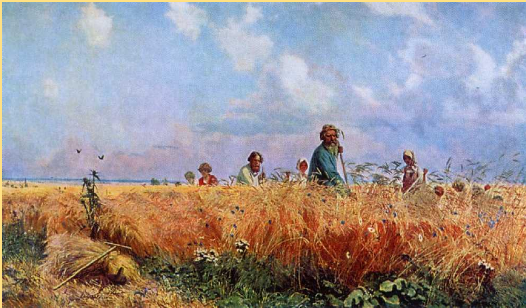
Г.Г. Мясоедов «Косцы».