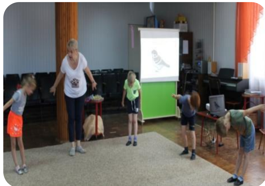
Музыкально-ритмическая композиция «Воробей»