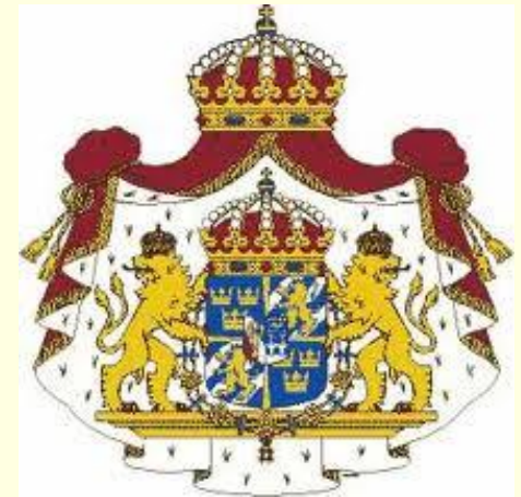
Большой герб Швеции