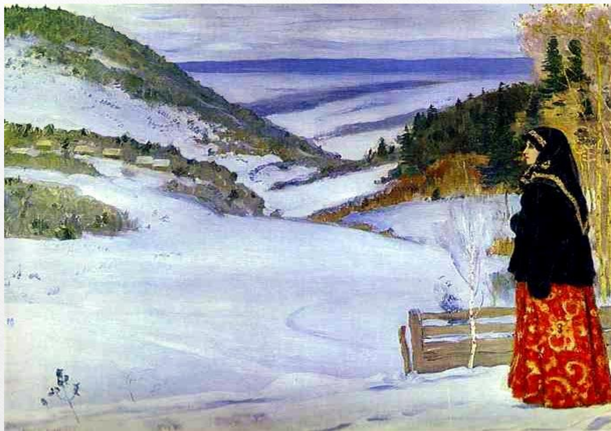
Михаил Нестеров «В скиту»