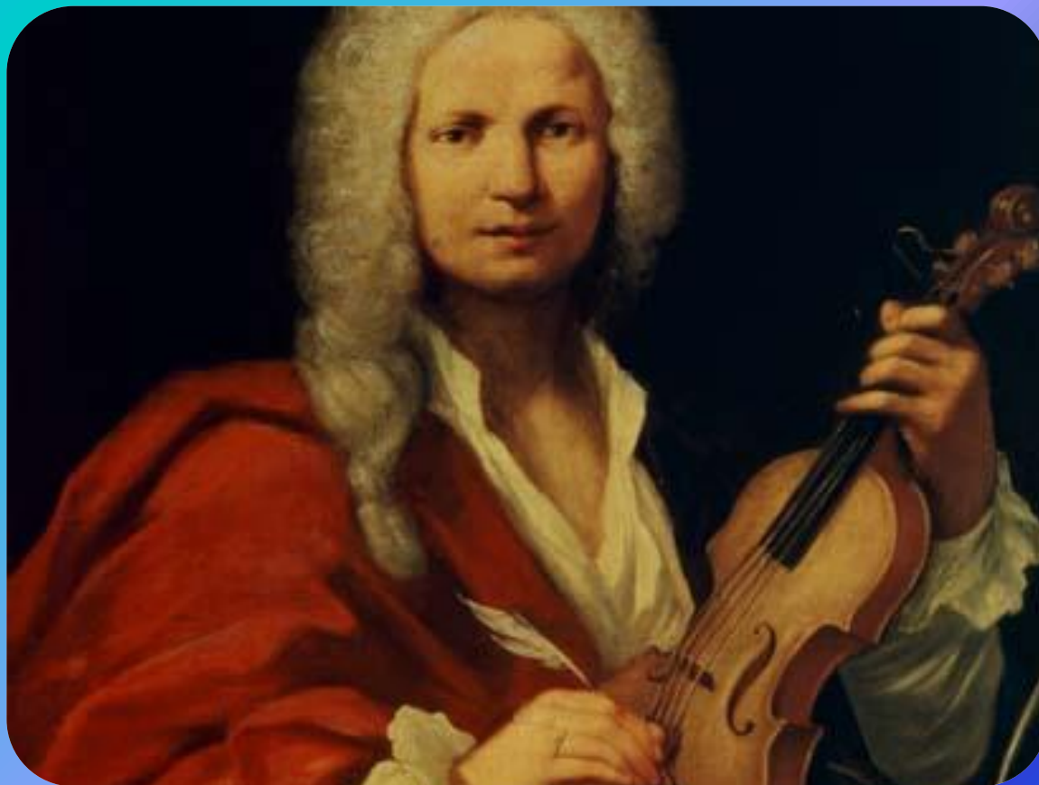
АНТОНИО ВИВАЛЬДИ (1678 - 1741)