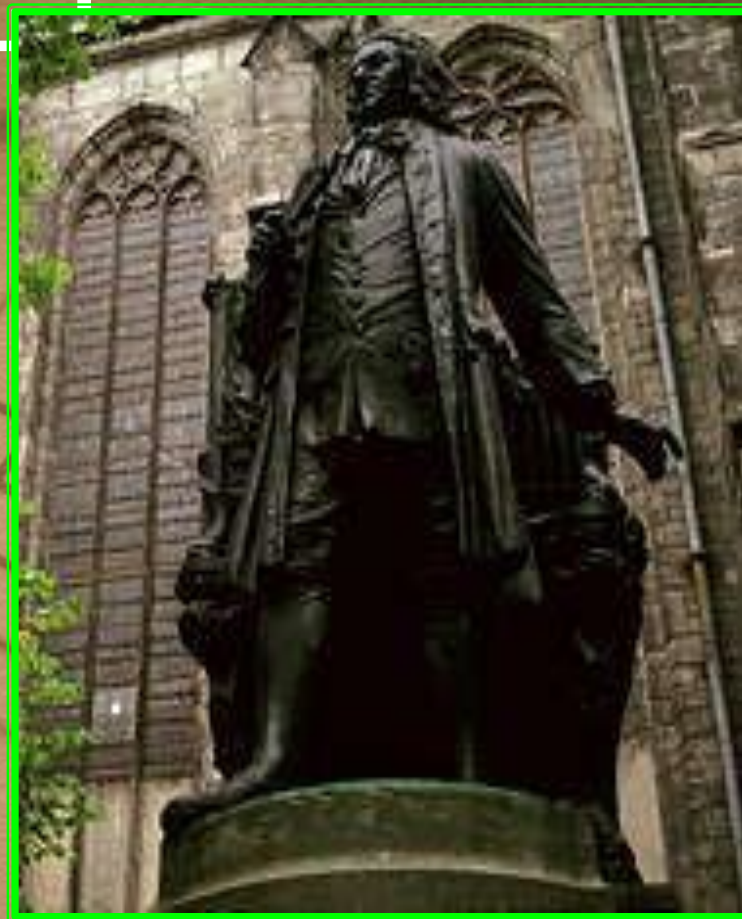
Памятник И.С.Баху в Лейпциге