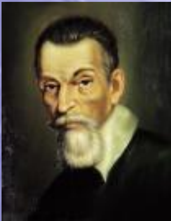
Клаудио Монтеверди (1567– 1643)