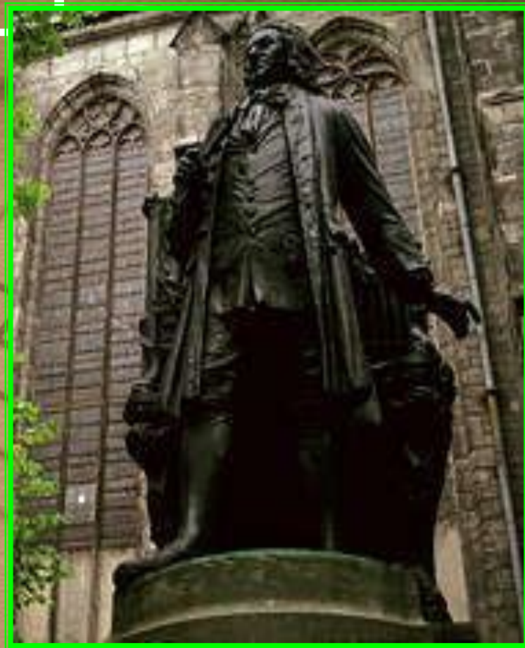
Памятник И.С.Баху в Лейпциге