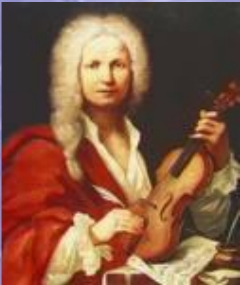
Антонио Вивальди (1678–1741)