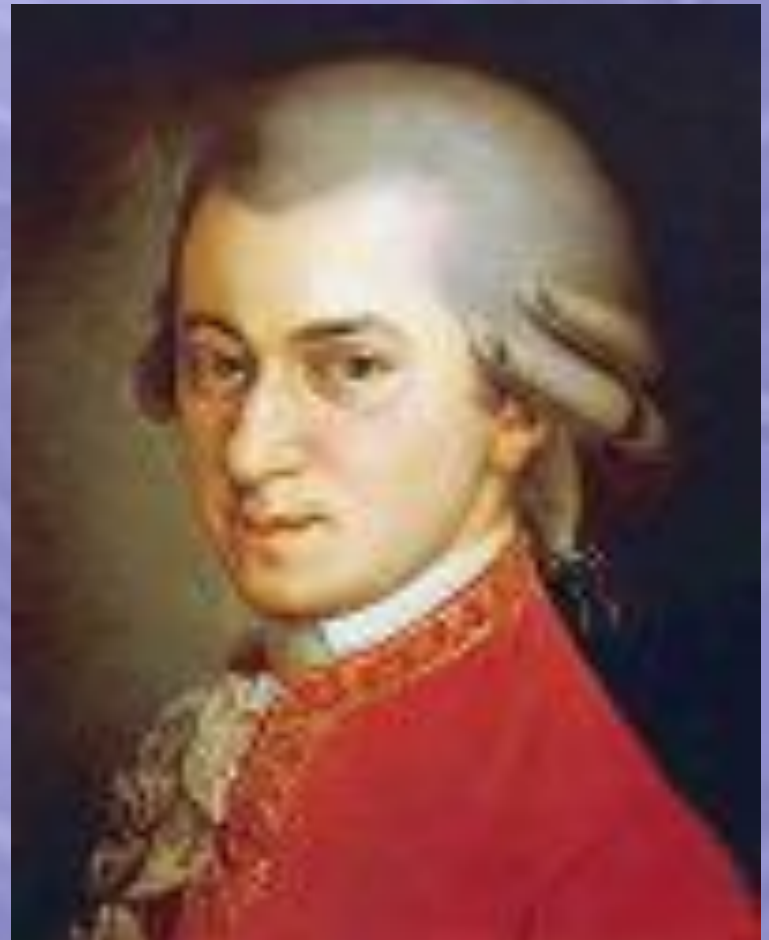
Вольфганг Амадей Моцарт (1756–1791)