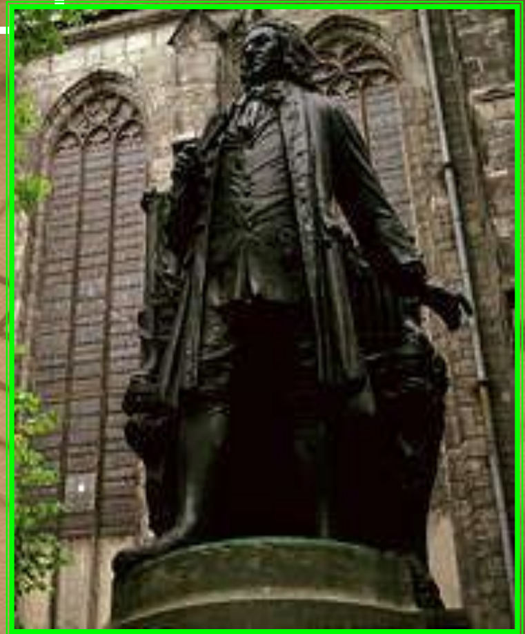
Памятник И.С.Баху в Лейпциге