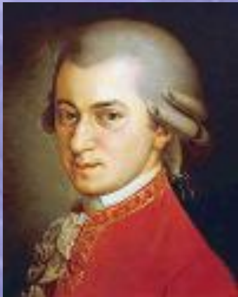
Вольфганг Амадей Моцарт (1756–1791)