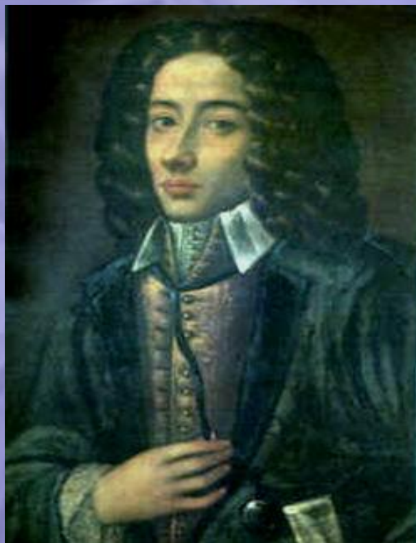
Джованни Баттиста Перголези (1710–1736)