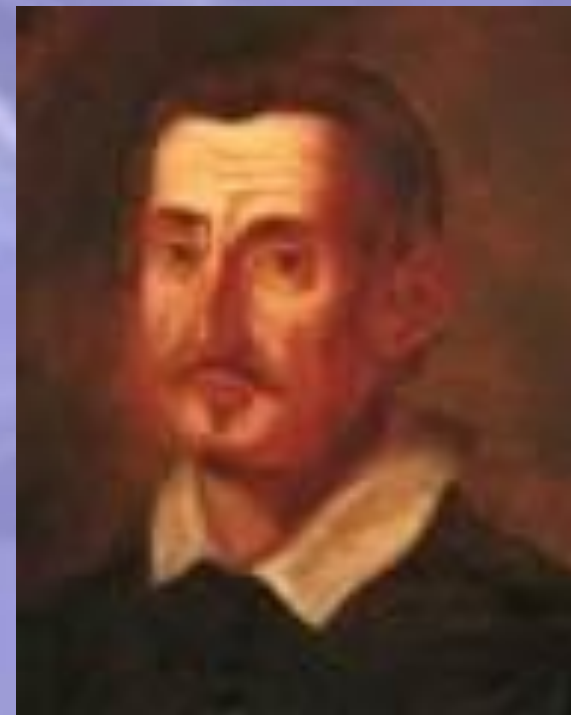
Джироламо Фрескобальди (1583–1643)