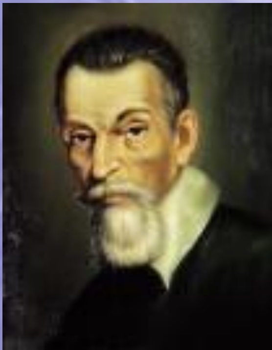
Клаудио Монтеверди (1567– 1643)