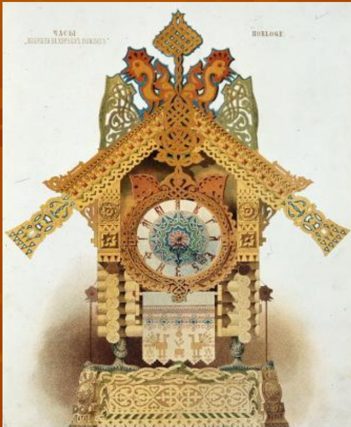
В. Гартманъ «Избушка Бабы-яги на курьихъ ножкахъ» часы въ русскомъ стилѣ XIV в., изъ бронзы съ эмалью