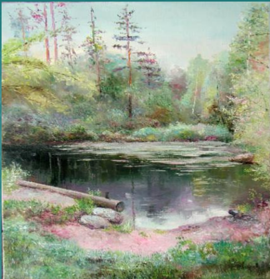
Владимир Картин «Лесное озеро»