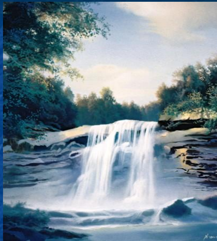
Вадим Секацкий «Водопад»