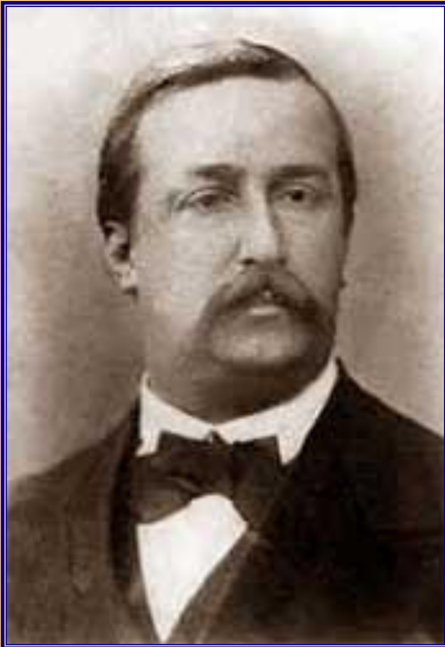
Александр Порфирьевич Бородин