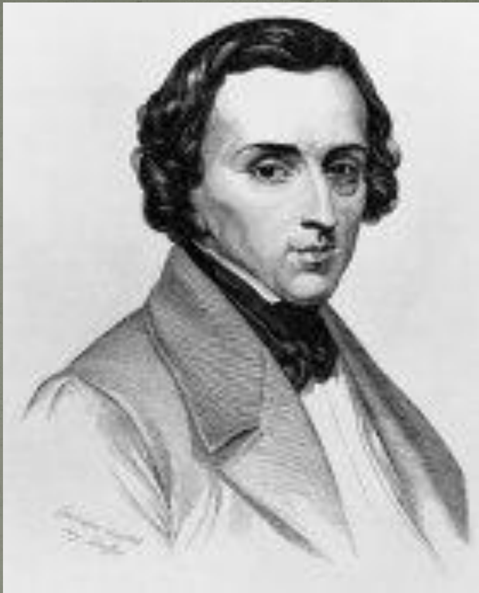
Фредерик Шопен (1810—1849)