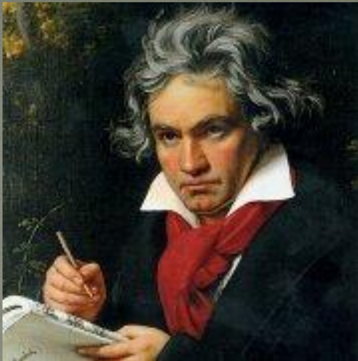
Людвиг ван Бетховен (1770—1827)