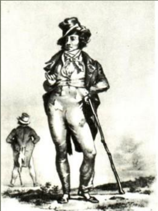
Фредерик-Леметр в роли Робера Макера. Театр «Амбигю комик». Париж. 1823.