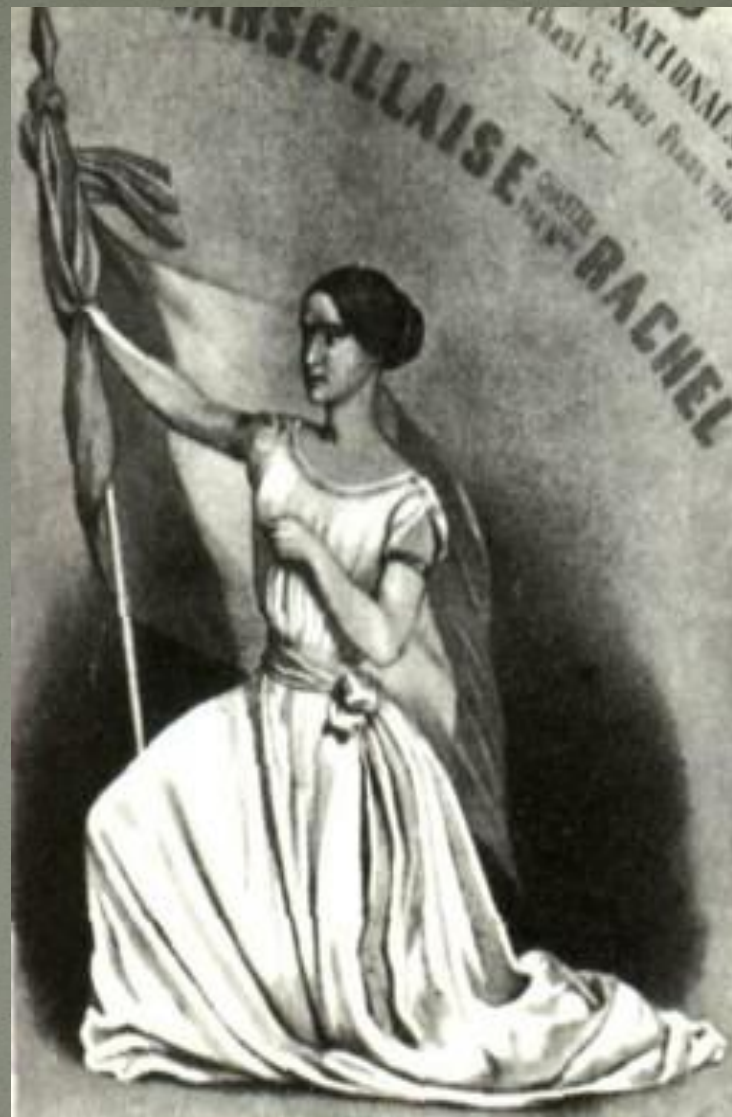
Элиза Рашель читает «Марсельезу».

Мари Дорваль с проникновенной силой играла женщин из народа и героинь, борющихся за свою любовь. Одним из чудесных ее созданий была Марион Делорм — героиня одноименной драмы Гюго (см. т. 11 ДЭ, ст. «Виктор Гюго»). За десятилетие перед революцией 1848 г. Элиза Рашель (1821 — 1858) возродила героические традиции классицизма, восприняв вместе с тем пламенность, страстную искренность романтических актеров. В ее исполнении трагедии Корнеля, Расина приобретали новое, современное звучание, насыщались духом народной борьбы в канун и дни революции 1848 г. Вдохновенное выражение ее искусства — «Марсельеза», которой актриса откликнулась на события 1848 г.