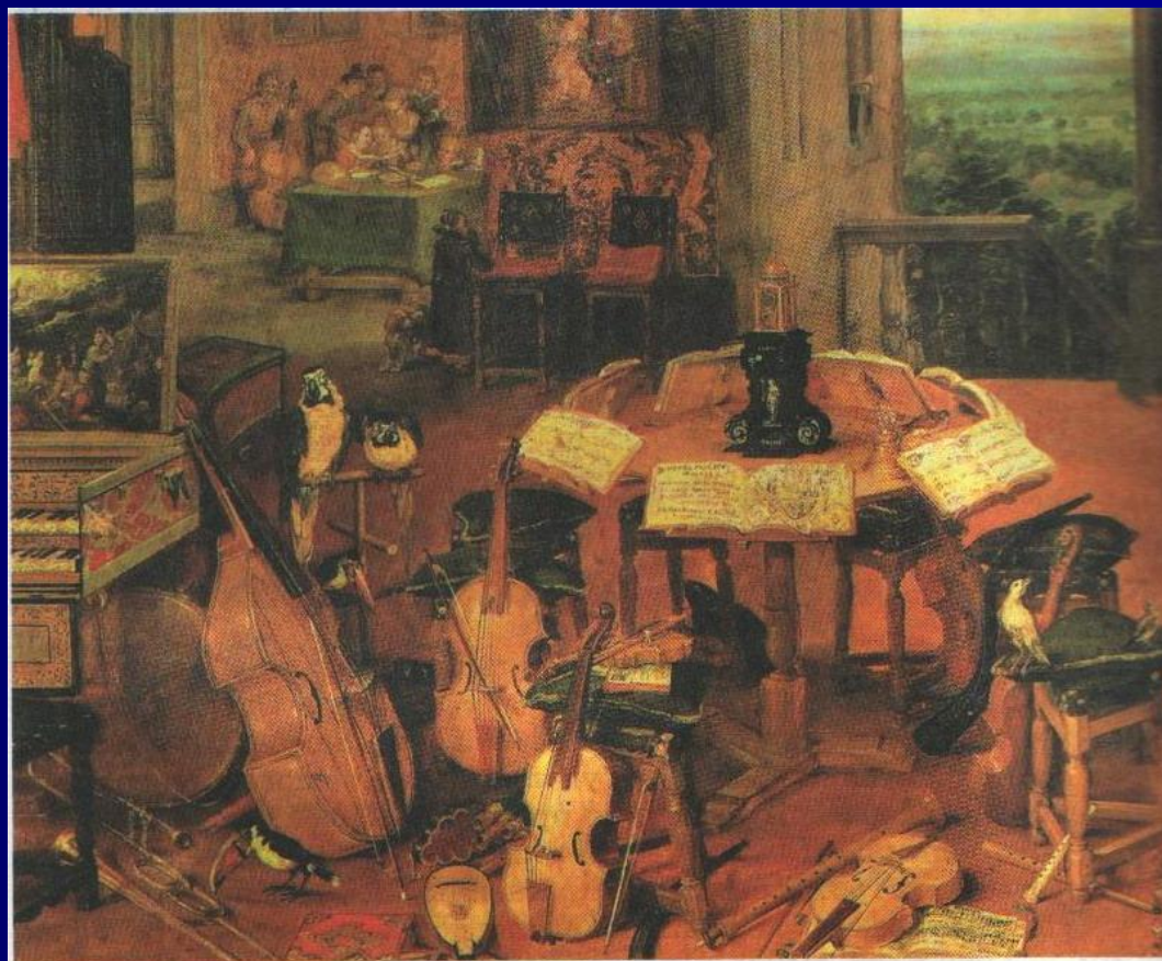
Музыкальные инструменты Возрождения: лира, виола, лютня