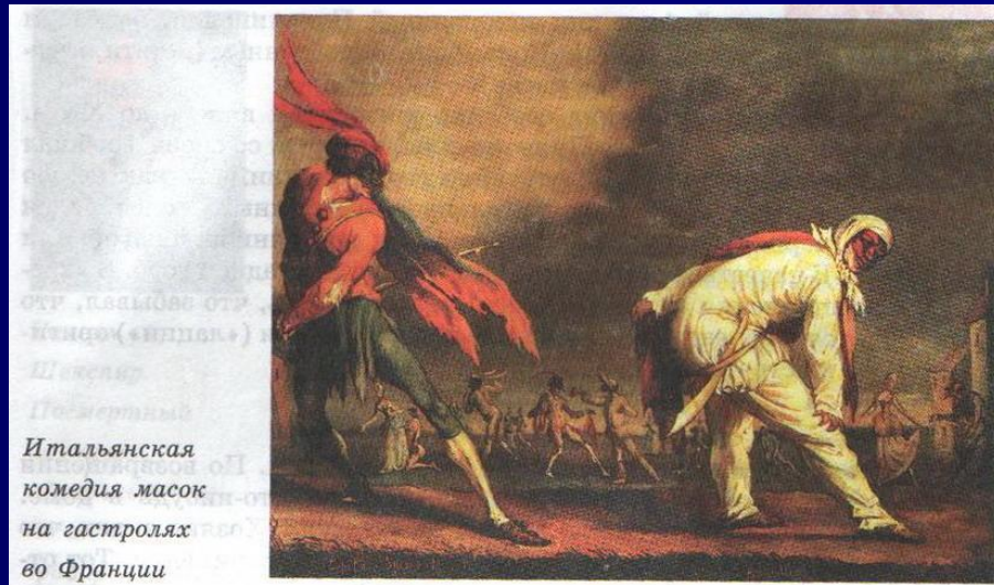
Итальянская комедия масок на гастролях во Франции