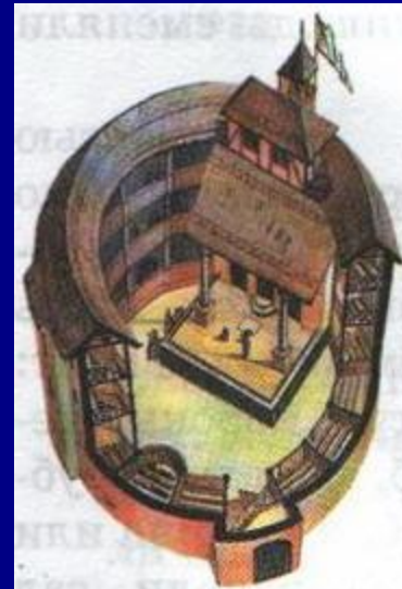
Спектакль в театре «Глобус». Реконструкция