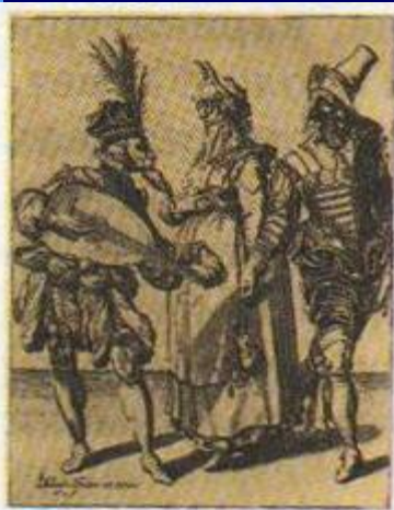
Якоб де Гейн. Комические актеры. XVI в. Гравюра

Музыка в комедии дель арте. Гравюра. Конец XVI в.