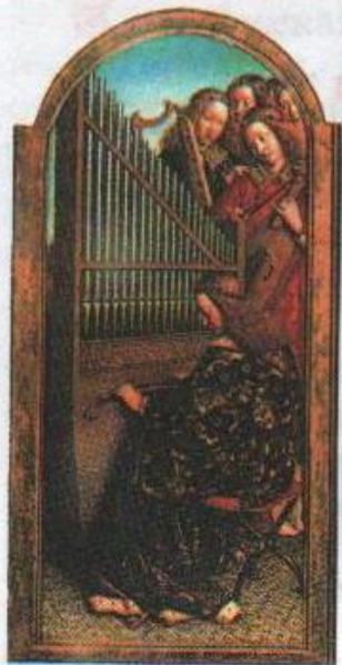
Ян ван Эйк. Музицирующие ангелы. Гентский алтарь. Около 1422—1432 гг. Собор Святого Бавона, Гент

Страница из собрания мадригалов Орландо Лассо