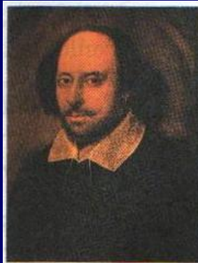
Уильям Шекспир. Посмертный портрет, сделанный по его гравированному изображению. 1623 г.