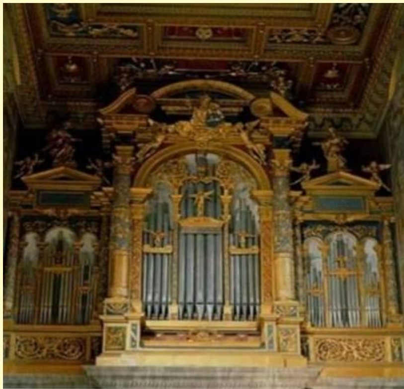
Орган 17 век в церкви Сан Джованни

Орган отливал серебром, Немой, как в руках ювелира, А издали слышался гром, Катившийся из-за полмира. Покоилась люстр тишина И в зареве их бездыханном Играл не орган, а стена, Украшенная органом. Ворочая балки, как слон, И, освобождаясь от брёвен, Хорал выходил, как Самсон, Из кладки, где был замурован.