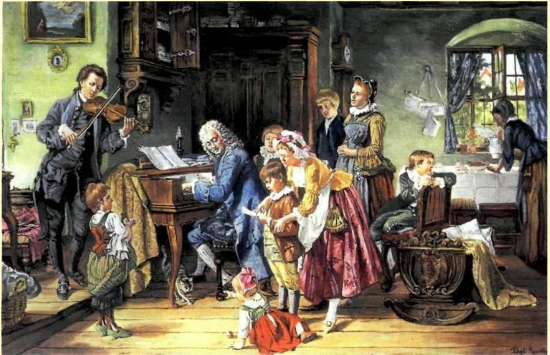
Семья И. С. Баха