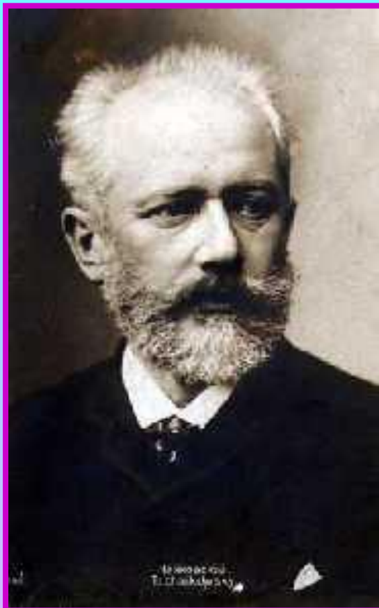
Петр Ильич Чайковский