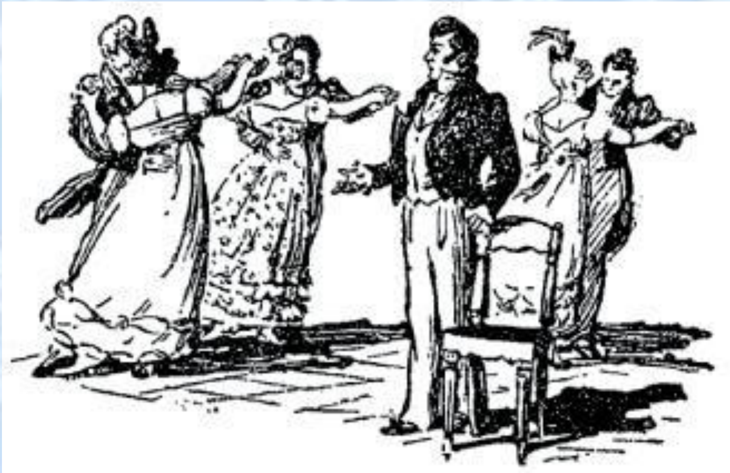
А.С. ГРИБОЕДОВ. Горе от ума. Концовка к III действию Рисунок Т. Шишмаревой