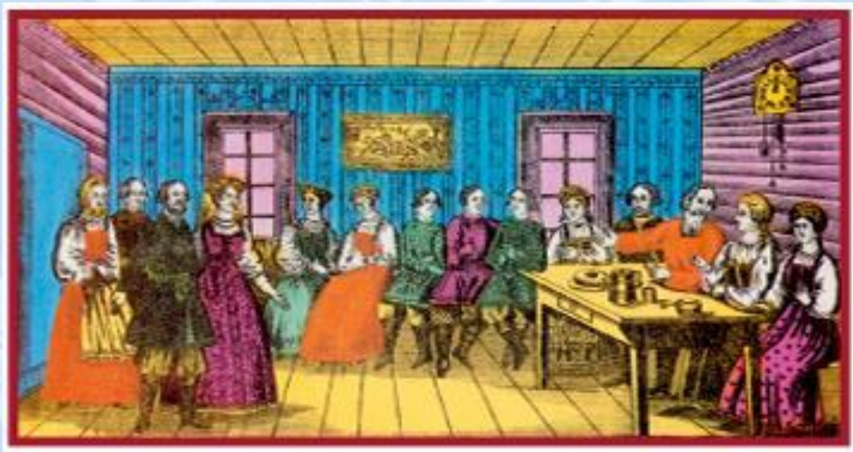
Русская деревенская песня. Лубок.