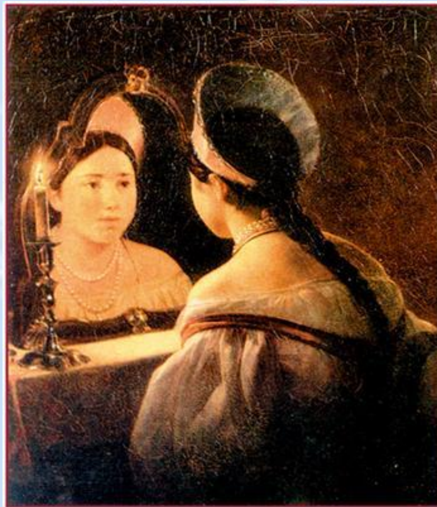
К. Брюллов. Гадающая Светлана. 1836

Нижегородский государственный художественный музей