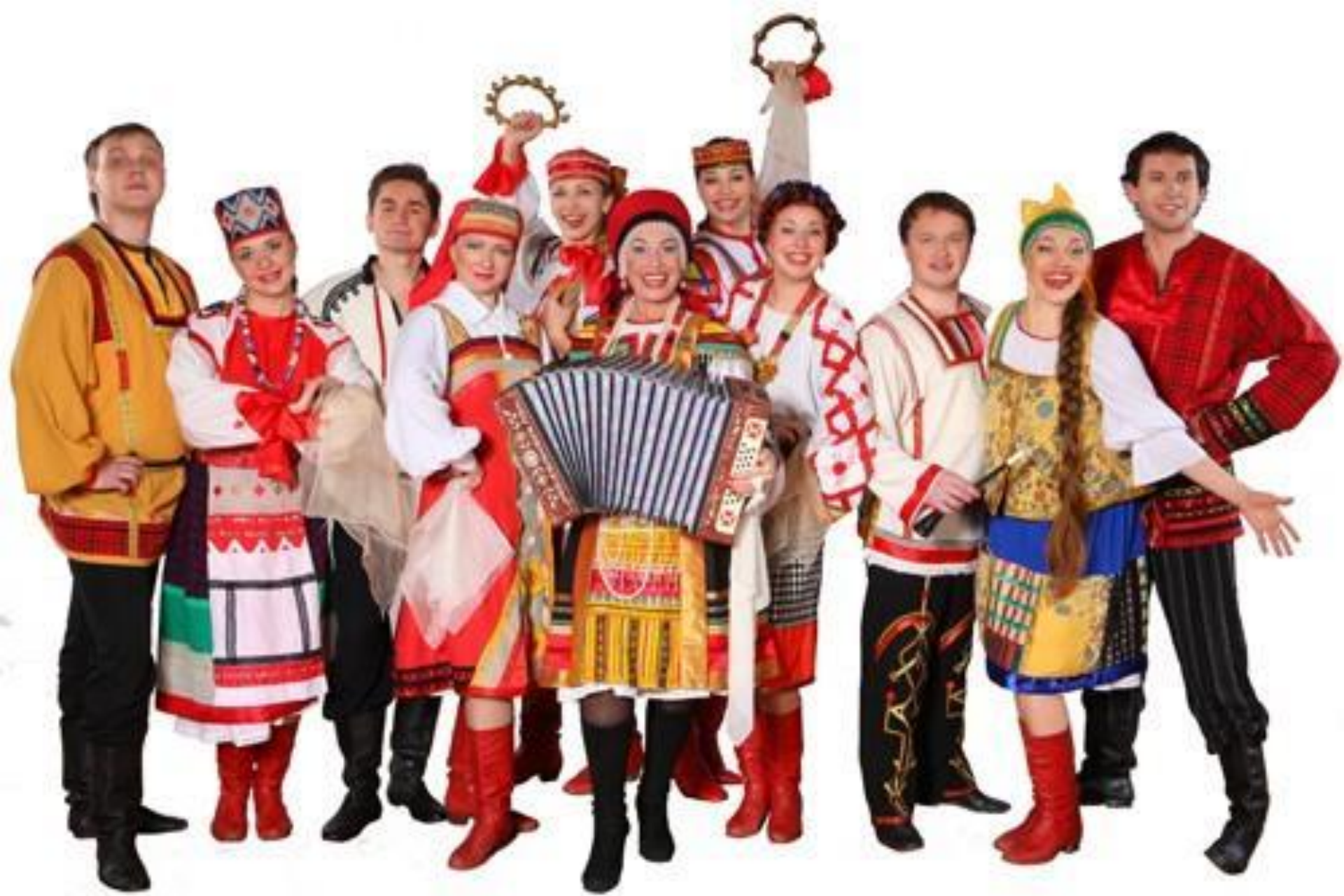
Надежда Бабкина и ансамбль «Русская досица»