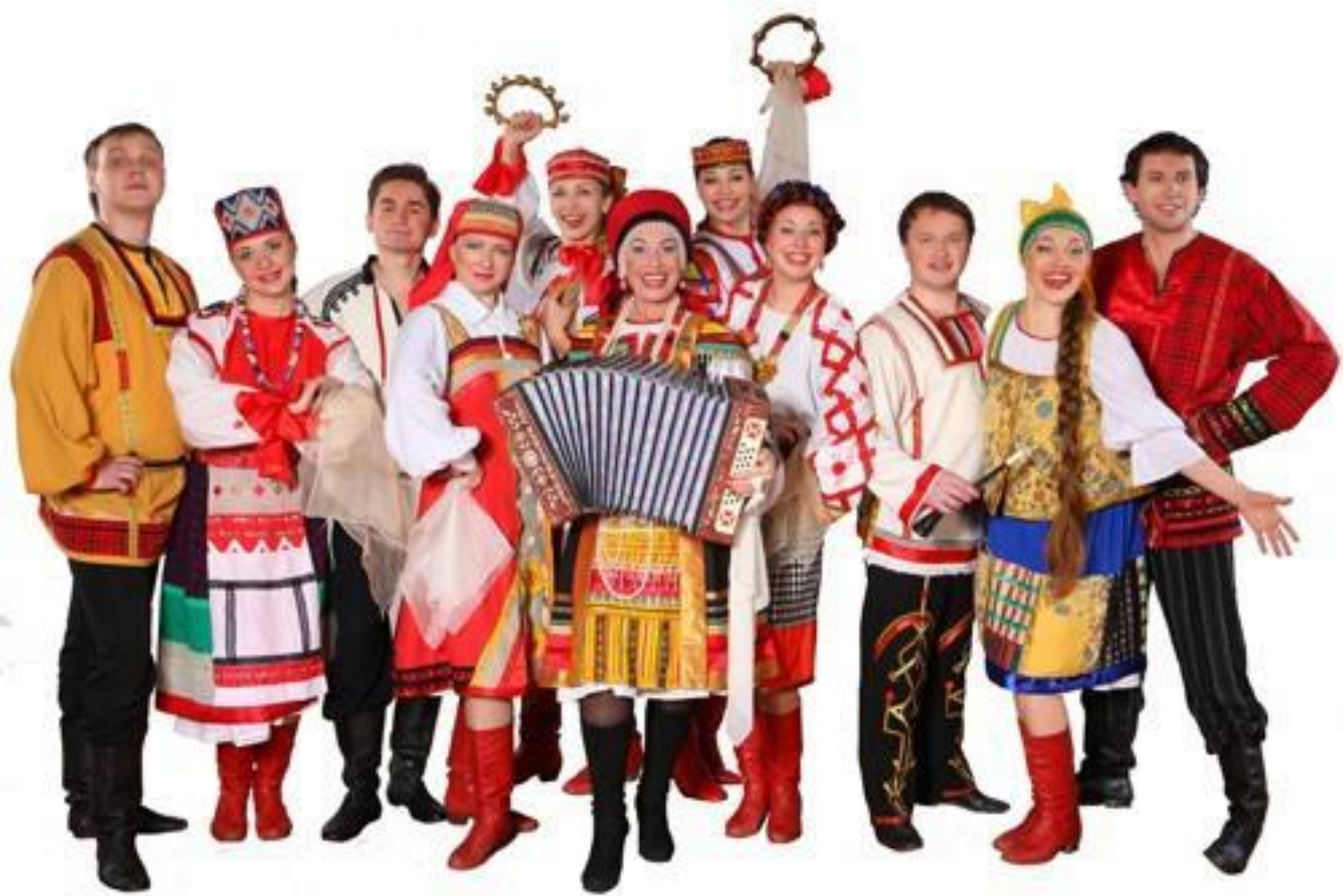
Надежда Бабкина и ансамбль «Русская досида»