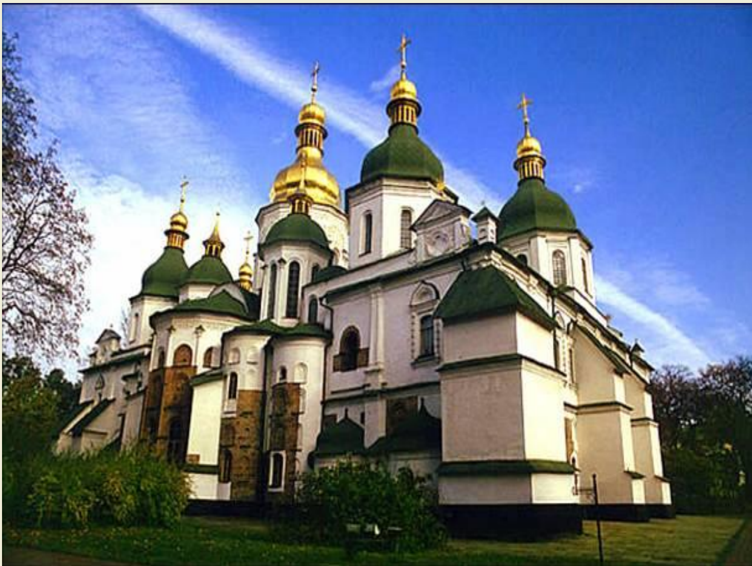
Собор святой Софии в Киеве. 1037г.