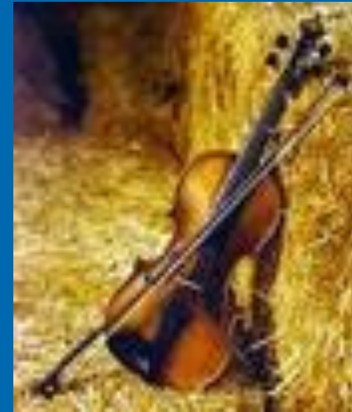
скрипка - фиддль