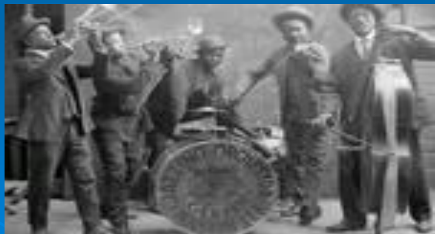
Джаз - бэнд