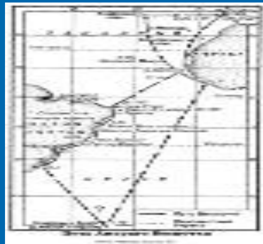
1499 – 1504г.г. «Новый Свет»