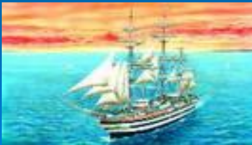
1507г.- новую часть света назвали Америкой