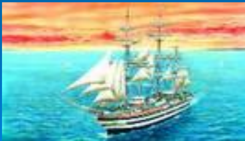
1507г.- новую часть света назвали Америкой