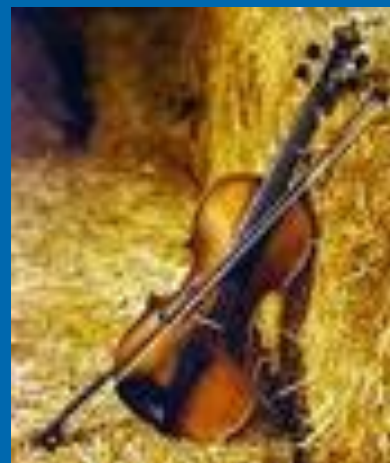
скрипка - фиддль