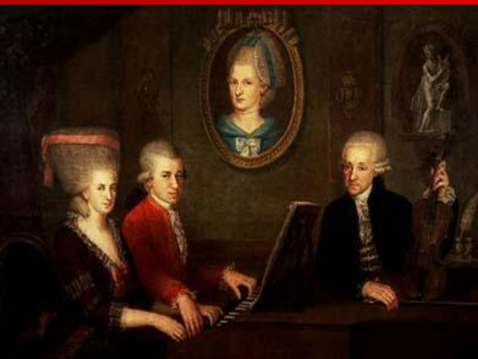
В. А. Моцарт с сестрой и отцом